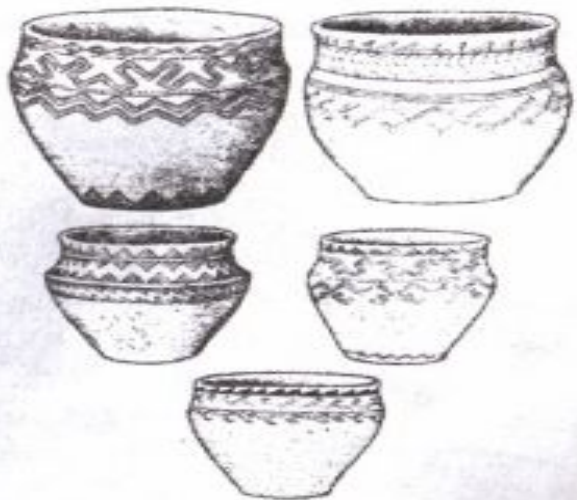
Орталық Қазақстандағы Андронов мәдениетінің Атасу кезеңіндегі қыш ыдыстар