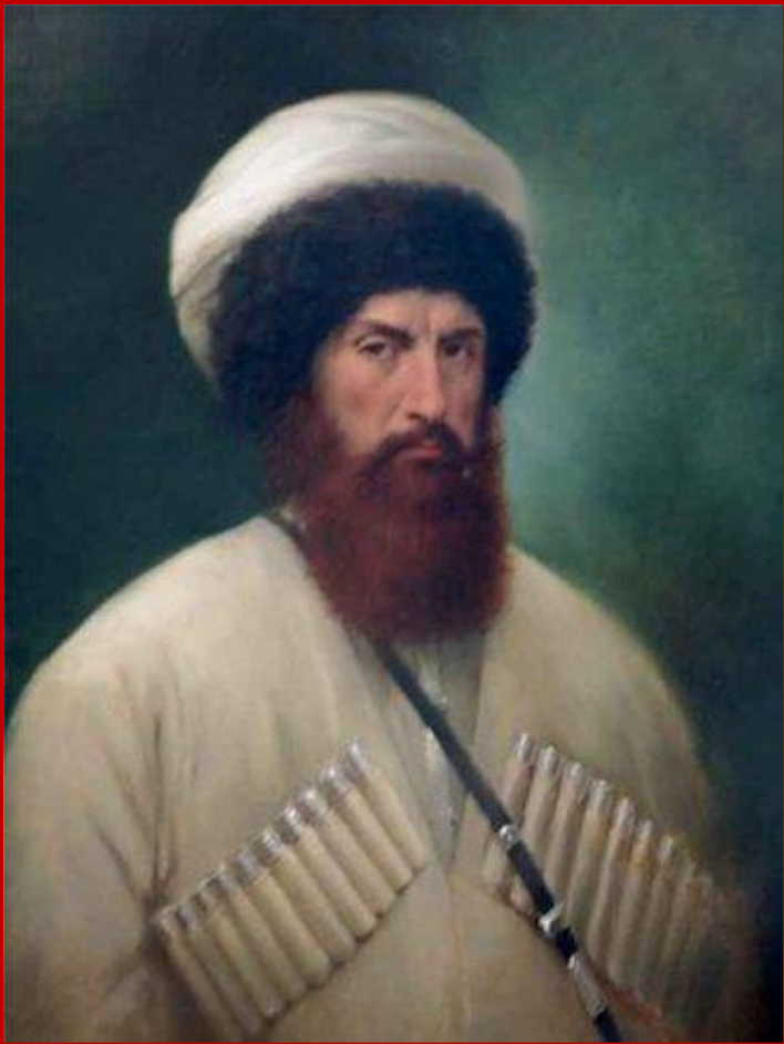
Имам Шамиль (1797) Имам