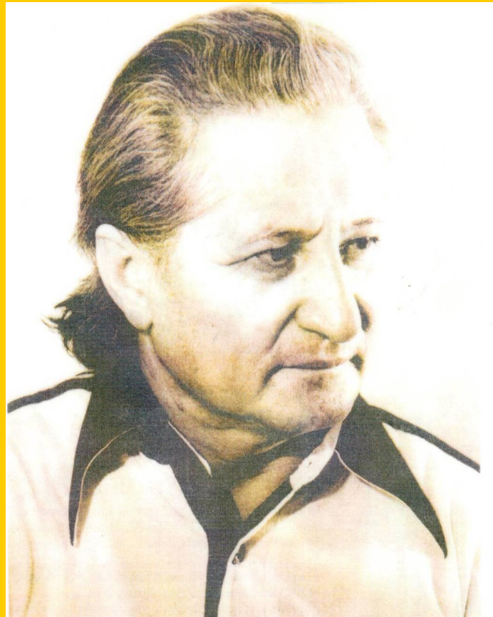
Қадыр Мырза Әли (1936 жылы туған)