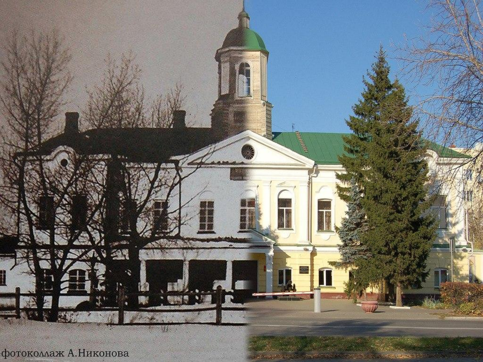
фотоколлаж А. Никонова