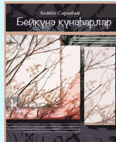
Алматы: Жалын, 2017.