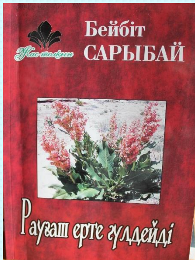
Алматы: Жалын, 2009. Таралымы 2000 дана.