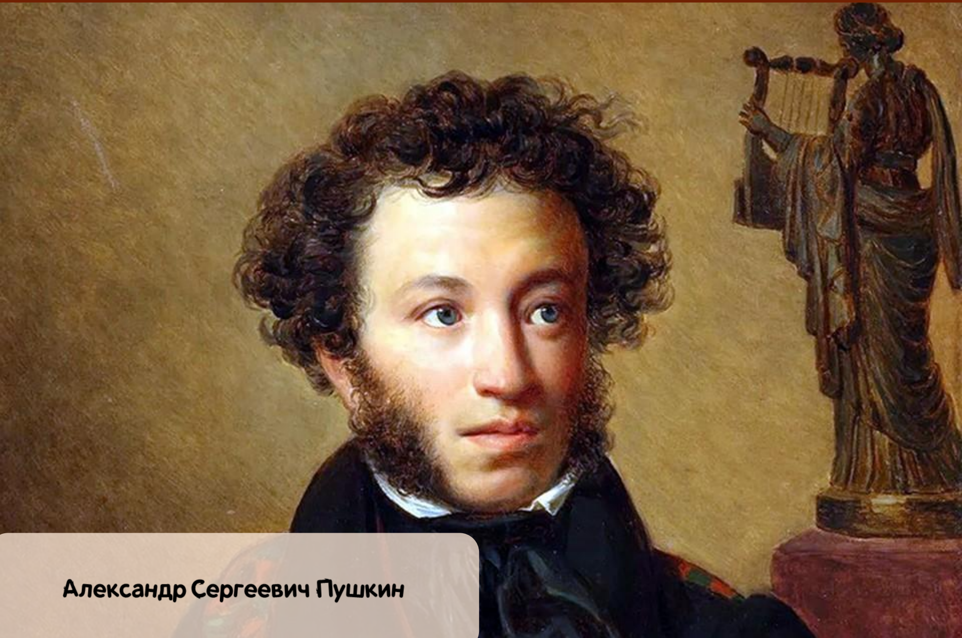
Александр Сергеевич Пушкин