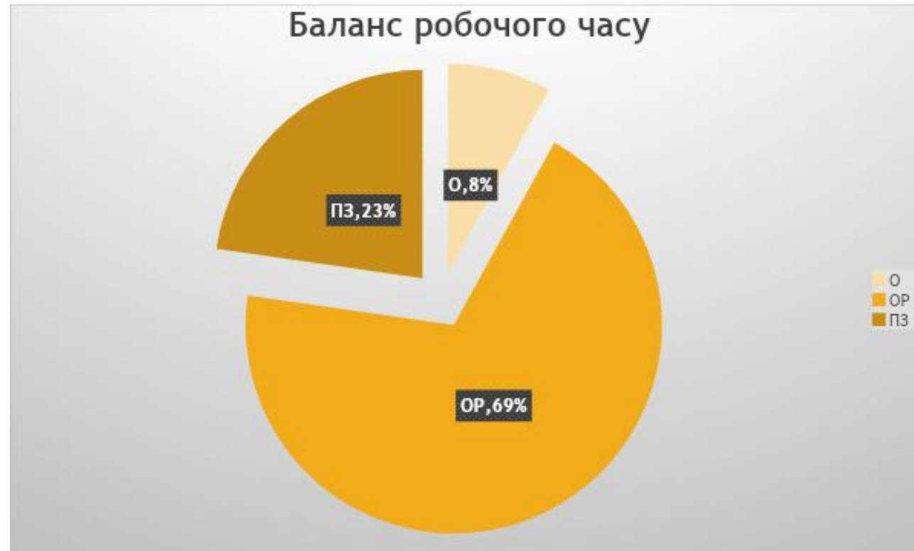
Діаграма «Фактичний баланс робочого часу гірничого майстра»