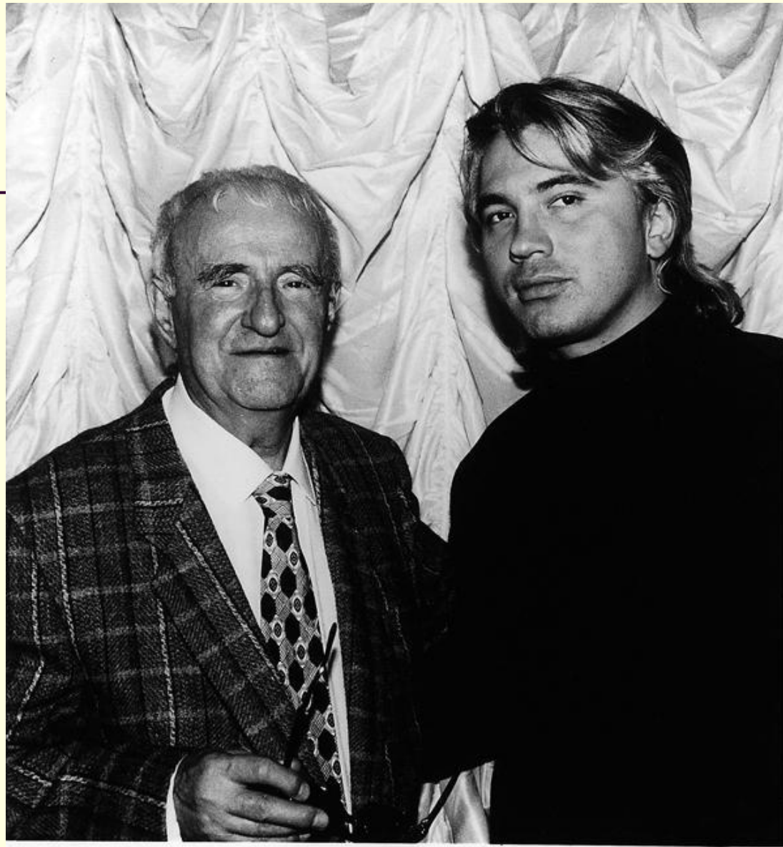
Georgii Sviridov and Dmitri Hvorostovsky