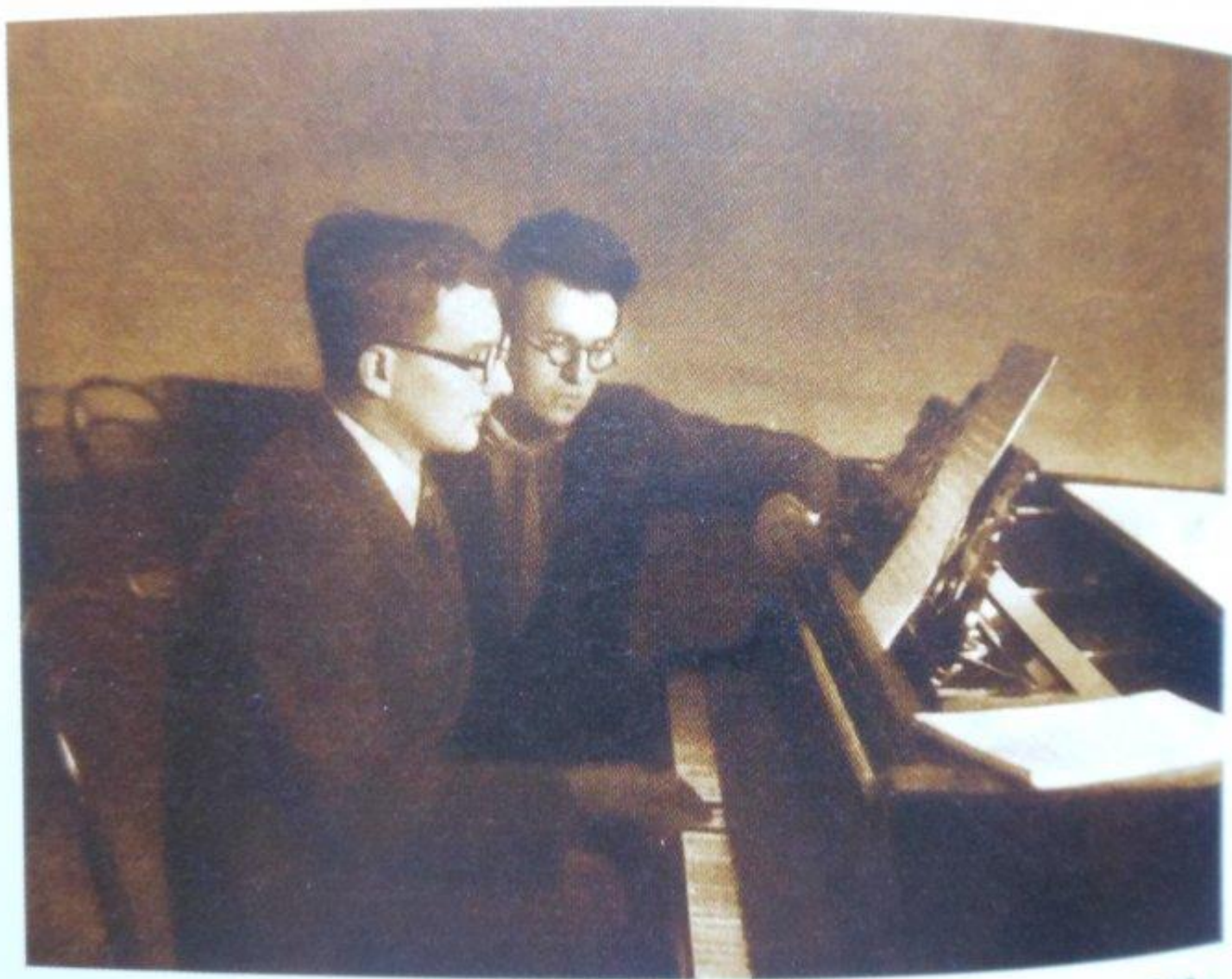
Д. Шостакович и Г. Свиридов, 1940 г.