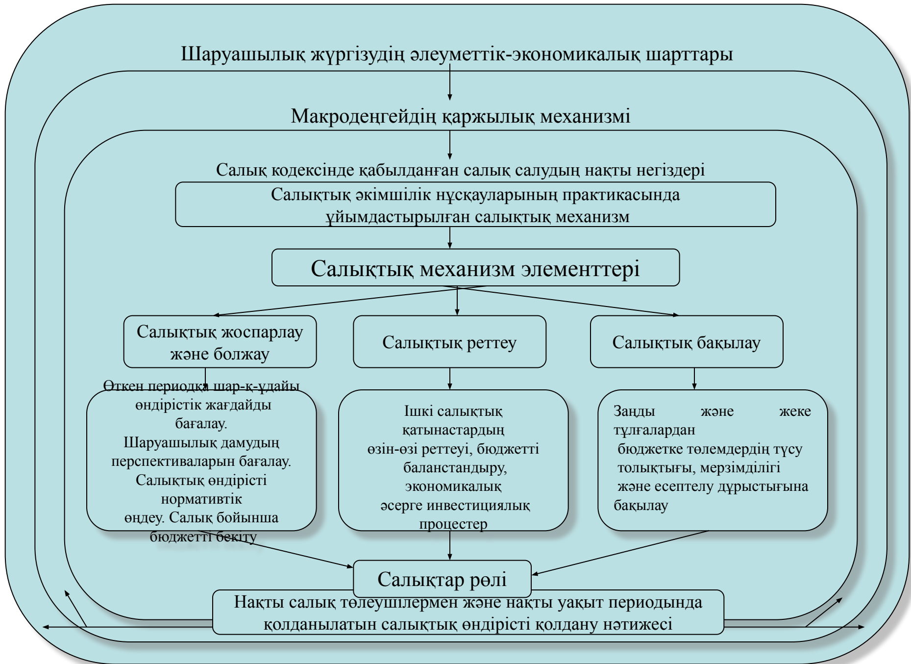
Сурет – Салықтық механизмнің функционалдық негіздері