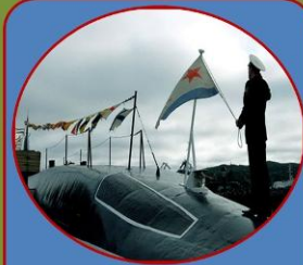
Военно- морской флот