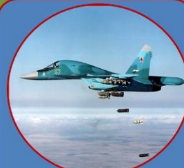
Военно- воздушные силы