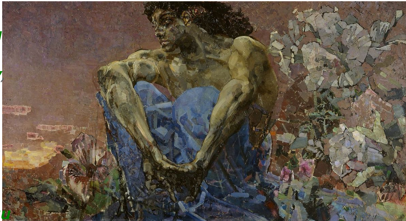
«Демон сидящий» Михаил Врубель 1890 г.

Один из ангелов, Денница «Утренняя заря» возгордился, и решил, что может стать равным Богу, к нему примкнули другие ангелы и восстали против Бога, но были низвержены в ад. Денница получил прозвище Диавол, или Сатана (клеветник, противник), а падшие вместе с ним ангелы – демоны (бесы).