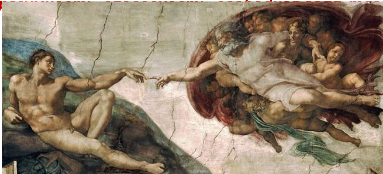
«Сотворение Адама» Микеланджело Буонарроти (Фреска. Сикстинская капелла) 1511 г.

гуманность, способность к добру, милосердие, сострадание.