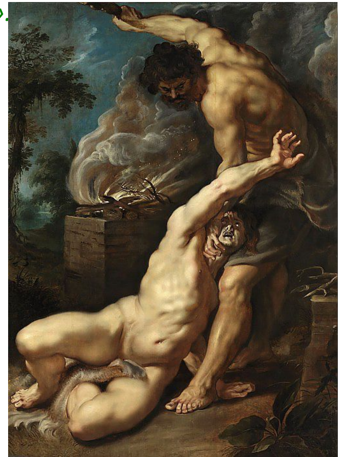
«Кайн убивает Авеля»