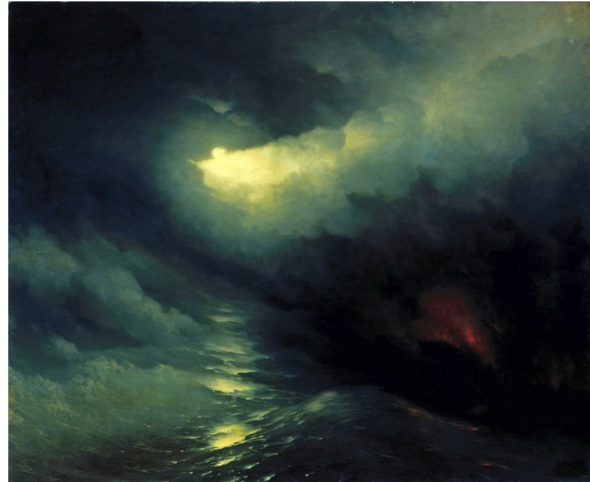
«Сотворение мира» Иван Айвазовский 1864 г.

« И сказал Бог: да будут светила на тверди небесной, для отделения дня от ночи, и для