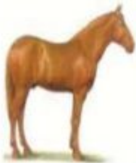
Орыстың желгіш жылқысы