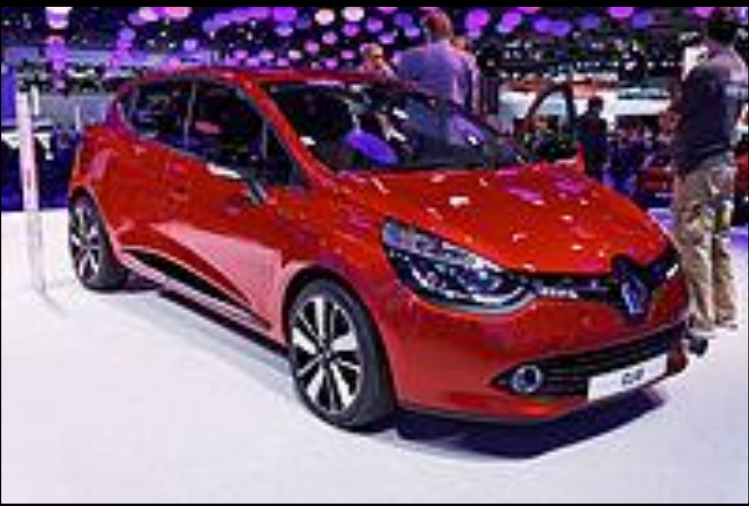
Автомобі ль року Іспанія

Словенія. Штаб-квартира та завод у м. Ново Место