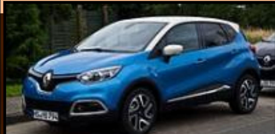
Renault Captur, Лідер позашляховик в