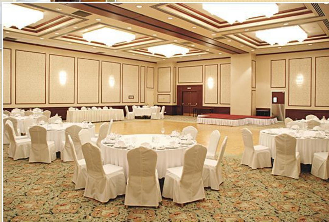
Банкетный зал «Петровский»