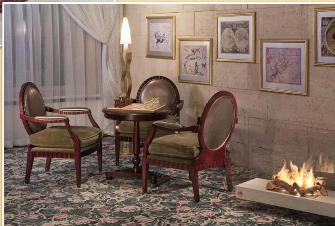
Бар «Аэростар Клуб»