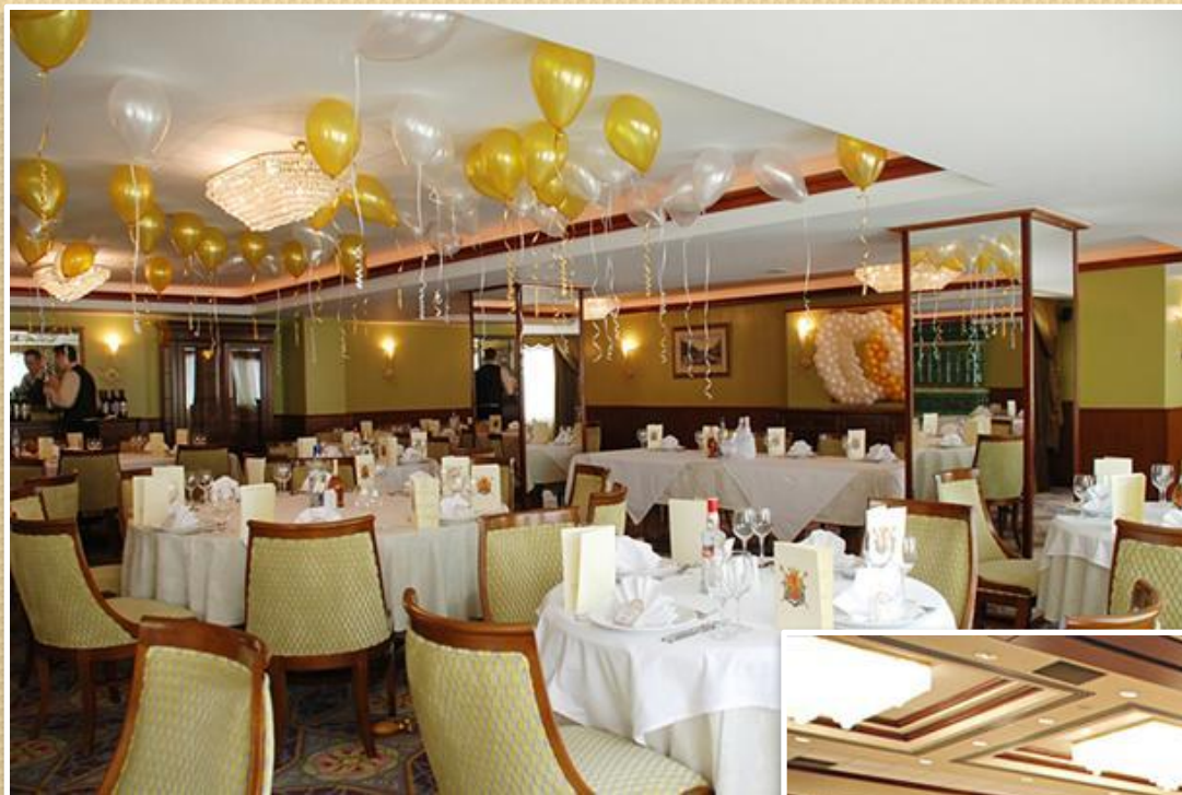
Банкетный зал «Петергоф»