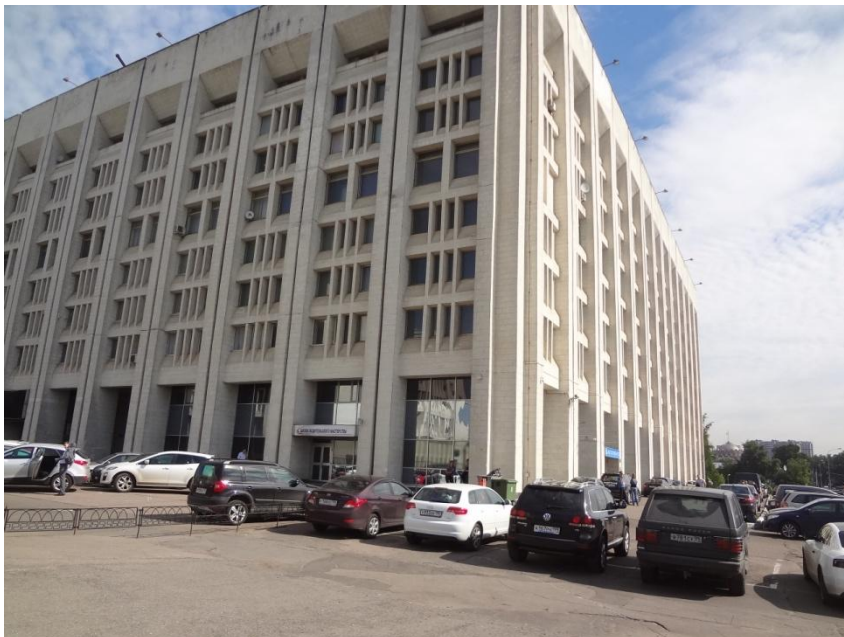
Фасад Бизнес-центра «Аэростар»