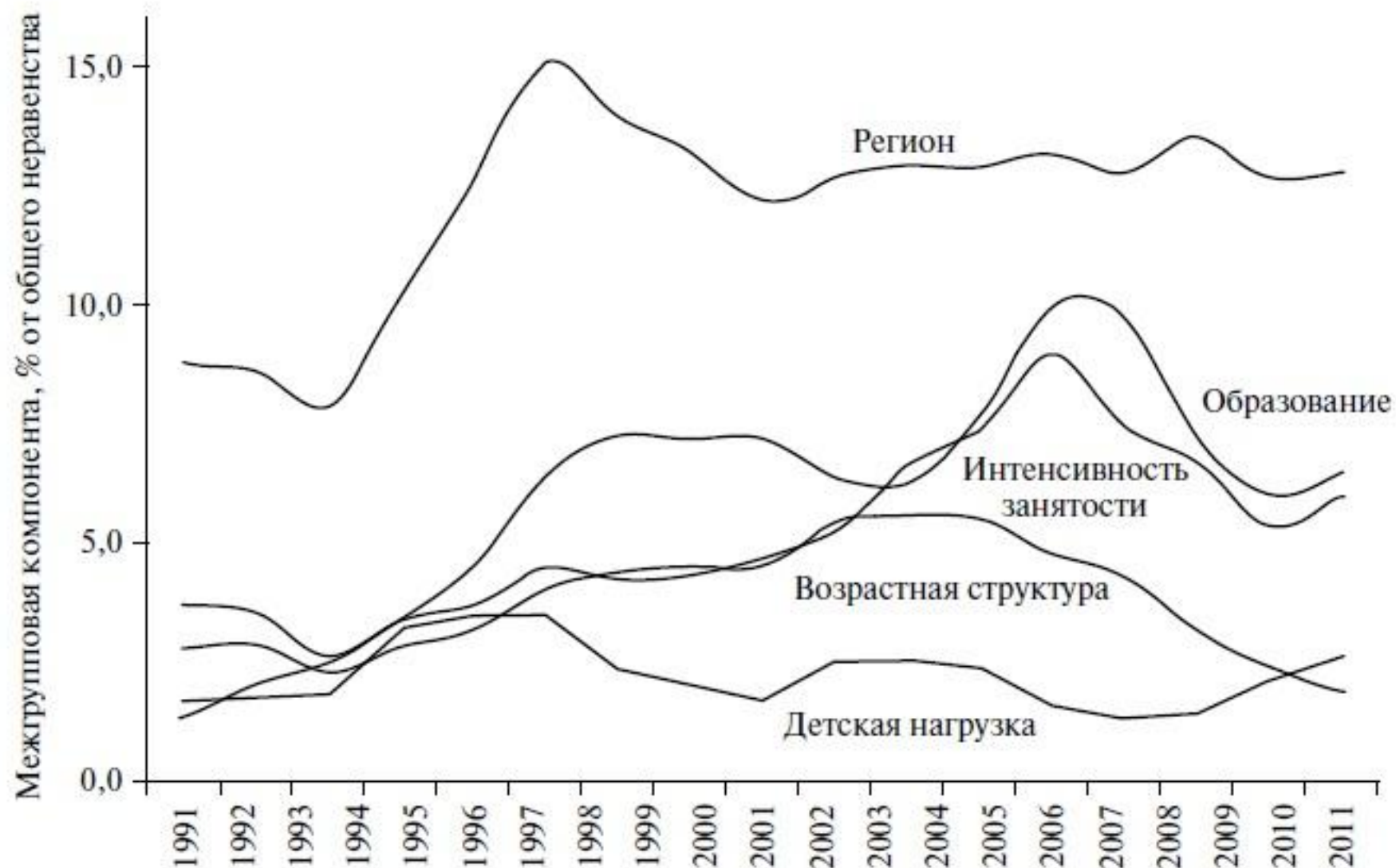
Рис. 4. Факторы неравенства в России на микроуровне в 1992–2010 гг. (вклад межгрупповой компоненты в общее неравенство, среднее логарифмическое отклонение)