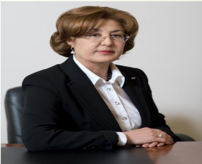
Лена Кармазина (Жампеисова) - заместитель министра финансов Республики Казахстан