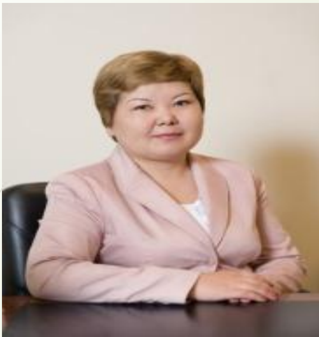
Дина Шаженова - ответственный секретарь министерства экономического развития и торговли