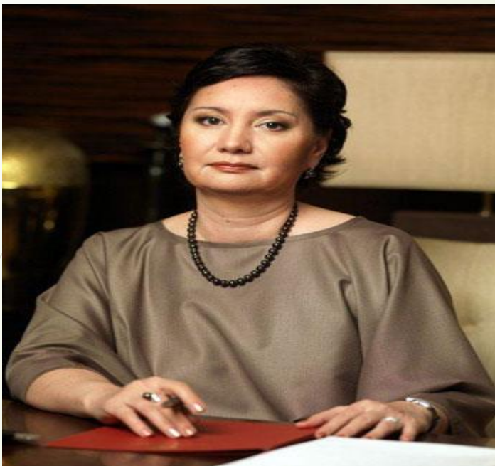
Гульшара Абдыкаликова – Государственный секретарь Республики Казахстан.