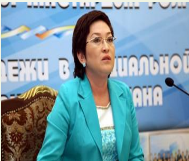
Алия Галимова – ответственный секретарь министерства образования и науки РК.