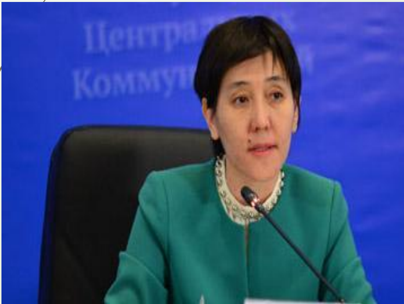
Тамара Дуйсенова - министр здравоохранения и социального развития РК.