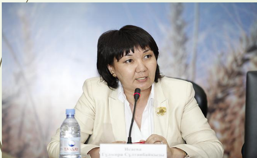
Гульмира Исаева - вице-министр сельского хозяйства Республики Казахстан.