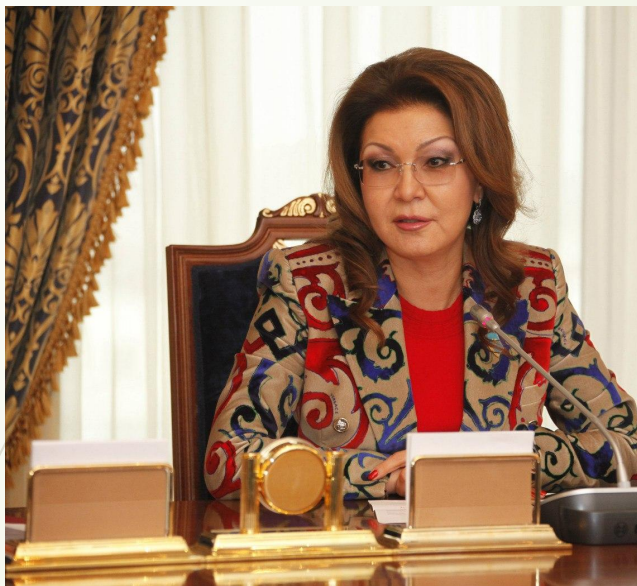
Дарига Нурсултановна Назарбаева — политический деятель Республики Казахстан.