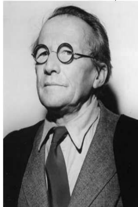
ШРЁДИНГЕР, ЭРВИН австрийский физик. Нобелевская премия по физике 1933 (с П.Дираком ).

\Psi(x, y, z, t) — волновая функция частицы.