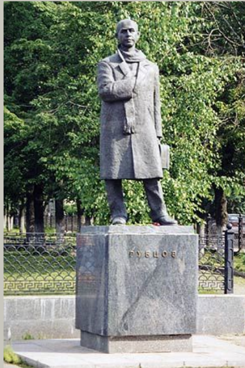
Памятник Н. Рубцову в г. Вологде