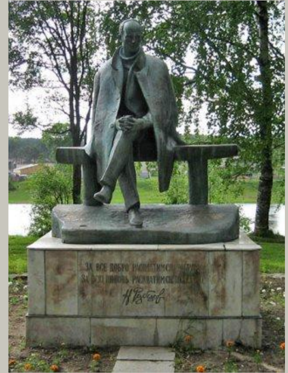
Памятник Н. Рубцову в г. Тотьме