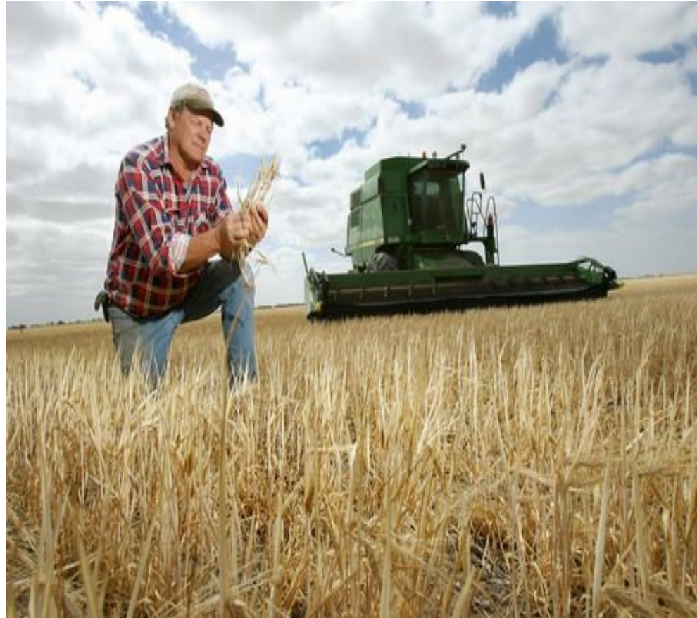
Австралийский фермер на поле пшеницы

Из них 22 млн.т – пшеница, которая выращивается в основном на юго-востоке. На северо-востоке выращивается рис, а в тропическом поясе – кукуруза и ячмень.