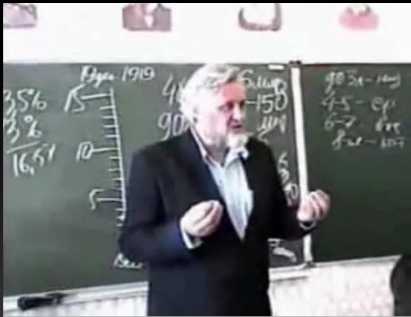
Чим дівчатка відрізняються від хлопчиків

Більшість наркотичних речовин (алкоголь, наркотики, тютюн) впливають на аспекти репродуктивної системи підлітка. Під їх впливом затримується статевий ріст, знижується кількість зрілих сперматозоїдів, порушується менструальний цикл, а повне припинення менструацій в молодому віці — прямий шлях до безпліддя. Та найбільшою проблемою є народження в майбутньому здорових дітей.