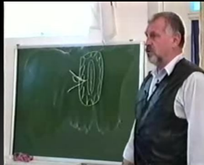
Вплив алкоголю на статеві клітини