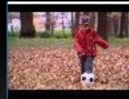
Хочеш бути батьком