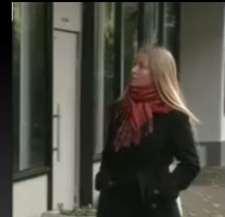
Хочеш бути мамою