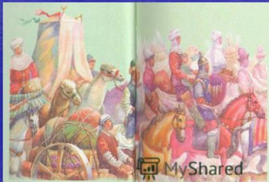
Ұлы көш. Суретші Қ.Каметов