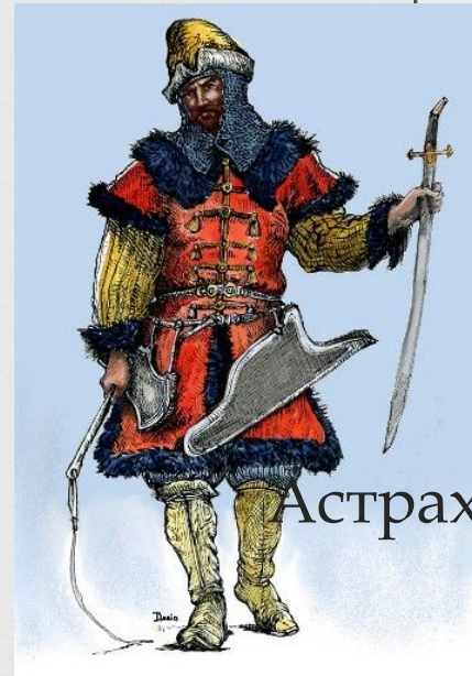
Хан Астраханского ханства Дервиш- Али