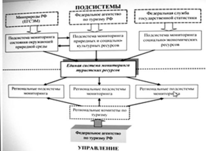
Рис.2.14. Организационная схема единой системы мониторинга туристских ресурсов