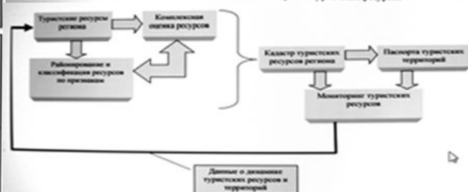
Рис.2.15. Система взаимодействия единой системы мониторинга туристских ресурсов