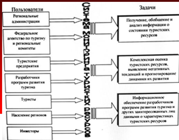
Рис.2.13. Основные задачи и потребители системы мониторинга туристских ресурсов