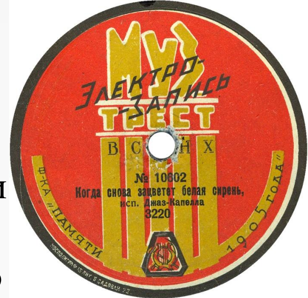
Первые советские пластинки (1919 г., Апрелевская фабрика)

В 1924-1927 г. советские пластинки выпускались под торговой маркой «Музпред» (на базе фабрики Pathé в Москве, в 1923 г. названной «Фабрикой имени пятилетия Октября», и Апрелевки, более 60 наименований), в 1927-1933 г. – под маркой «Музтрест» (на тех же мощностях, около 300 наименований).