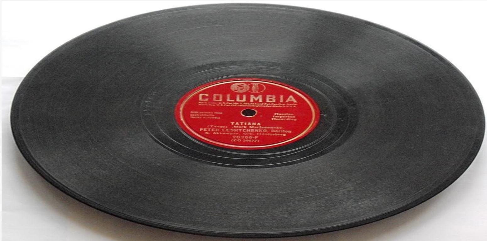
Одна из первых виниловых пластинок, 1948 г.

Массовое производство виниловых пластинок началось в конце 50-х годов XX века. Винил не так сильно изнашивает иглу при проигрывании, более пластичен (что позволяет плотнее нарезать дорожки) и, что немаловажно, более устойчив к механическому воздействию (изгибам, ударам, падениям).