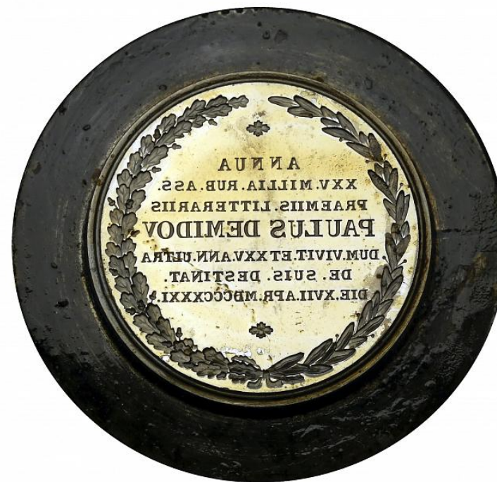
Экспонаты из архива сектора краеведения МБУК «ГавриловЯмская МЦРБ»

В предвоенные, военные и первые послевоенные годы советские пластинки можно было не только купить в магазине, но и взять во временное пользование в просветительских, агитационных пунктах и библиотеках, подобно книгам. Также, определенное количество старых пластинок можно было обменять новую (старые принимались на вес), с доплатой или без. На этикетках таких дисков ставился обязательный специальный чернильный или производственный штамп «Продаже не подлежит».