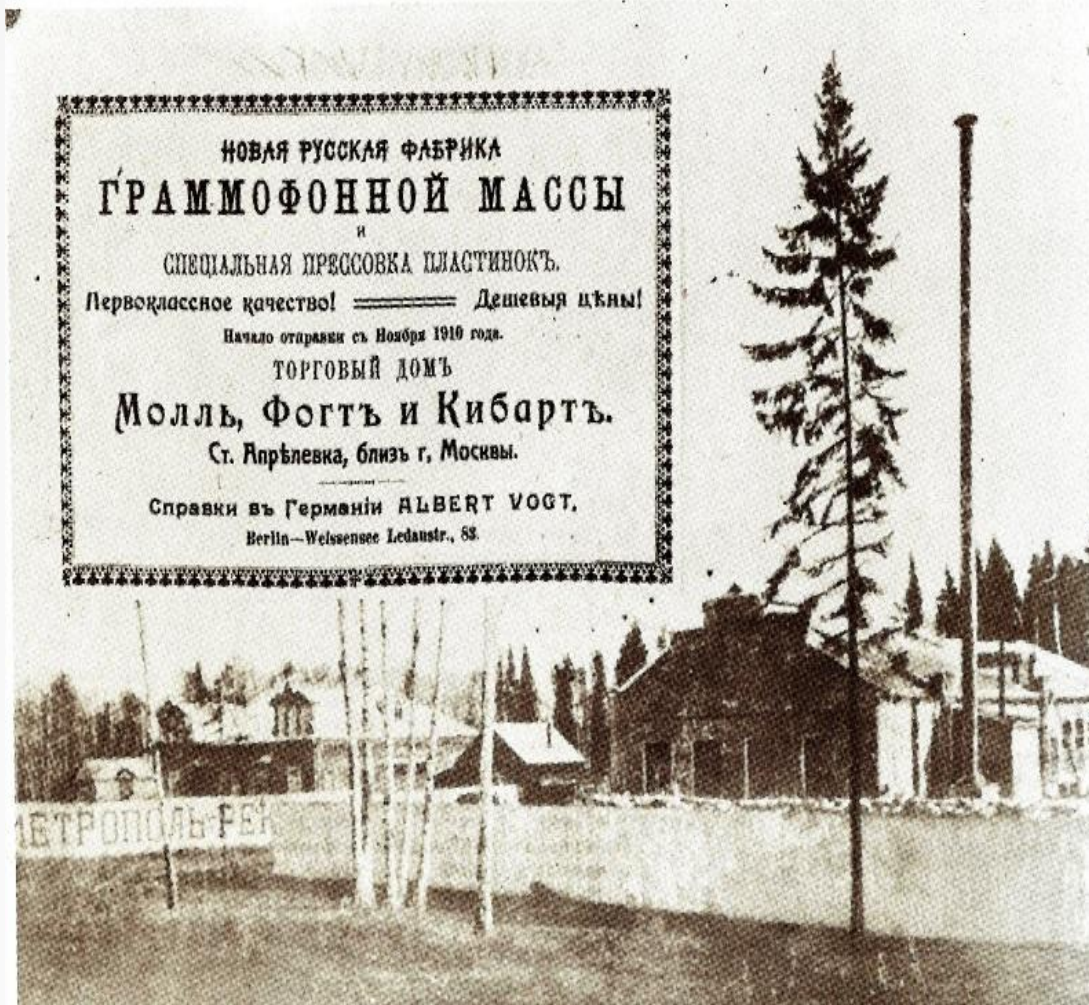
Рекламное фото Апрелевской фабрики в журнале "Граммонный миръ"

Здесь был организован весь цикл производства шеллачных дисков (запись, изготовление матриц, производство шеллачной массы, штамповка, а чуть позже— и изготовление конвертов и альбомов для грампластинок)