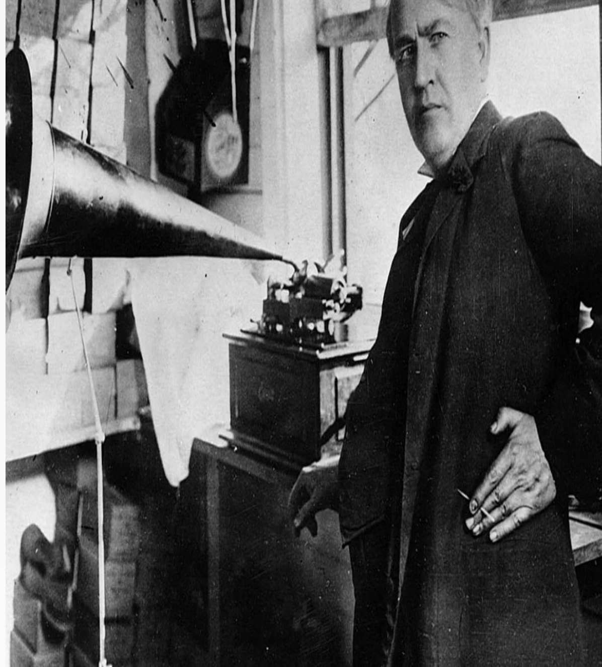
Фонограф Томаса Эдисона, 1899 г

В этом же году французский поэт и изобретатель Шарль Кро научно обосновал и пояснил принцип записи звука на барабан и последующее его воспроизведение.