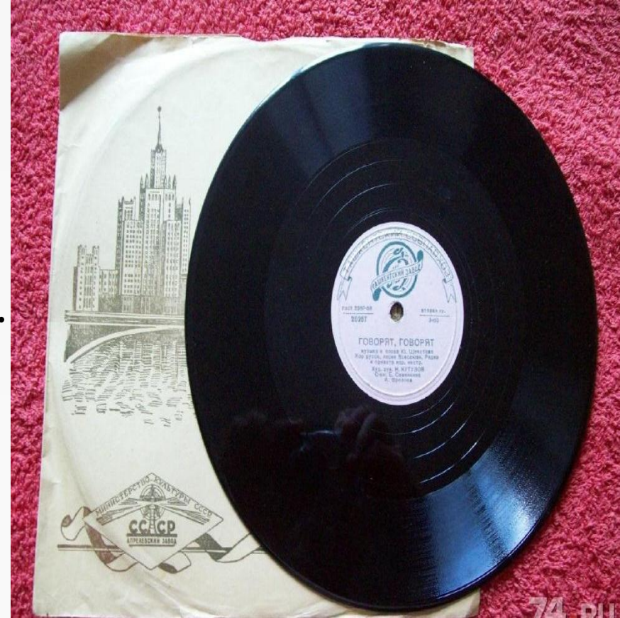
Грампластинка из шеллака, 30-е годы прошлого века

Материалом для тиража первоначально стал эбонит, но, вследствие дороговизны, он вскоре был заменен на шеллак (органическая природная смола). Серийное производство шеллаковых дисков началось в 1897 г.