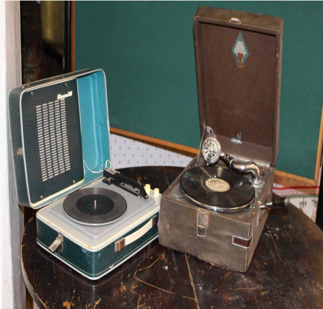
Экспонаты из архива сектора краеведения МБУК «Гаврилов-Ямская МЦРБ»

(бумажные пластинки с тонким слоем воска), гибкие пластики выпускаемые в широкой цветовой палитре и знаменитый «рок на костях» - музыка записанная на рентгеновских снимках.