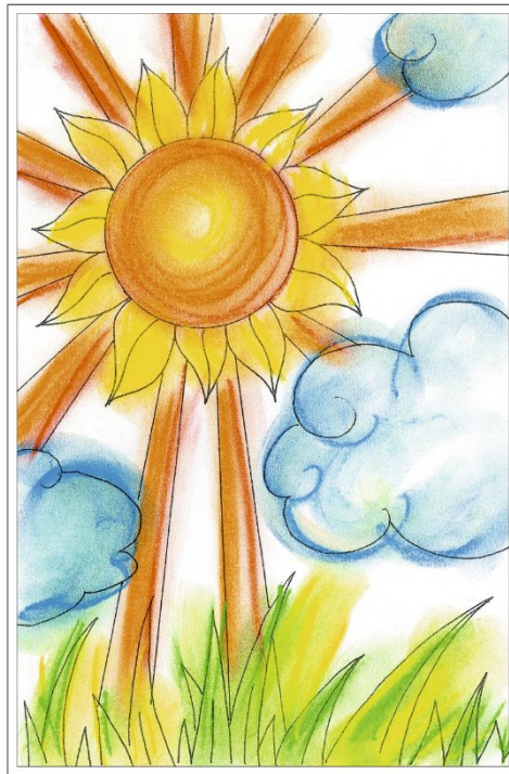
Солнышко «Простое» описание на стр. 32

Книга содержит методические рекомендации, планирование и конспекты занятий на год, игры с цветом, описание поделок к праздникам.