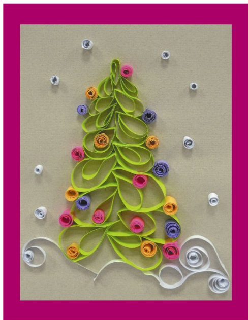
Танец елок «Сложное» описание на стр. 107

В книге содержатся методические рекомендации, планирование конспекты занятий на год, основы дизайна интерьера, игры с цветом, описание поделок к праздникам. Готовятся к печати книги «Цвет творчества. Младшая группа» и «Цвет творчества. Подготовительная группа».