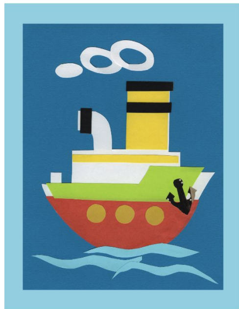
Кораблик «С усложнением» описание на стр. 40