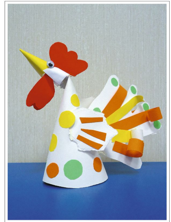
Петушок «Сложное» описание на стр. 53