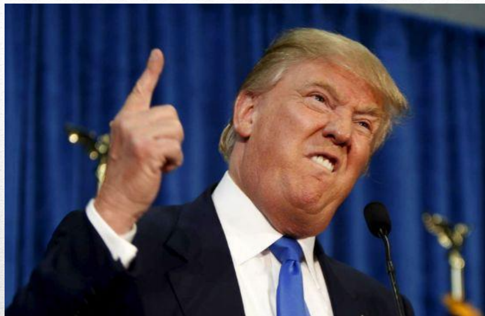
45 Президент США Дональд Трамп

Высшим органом исполнительной власти в стране является президент США . Имеется также пост вице-президента , который является вторым лицом в стране после президента.