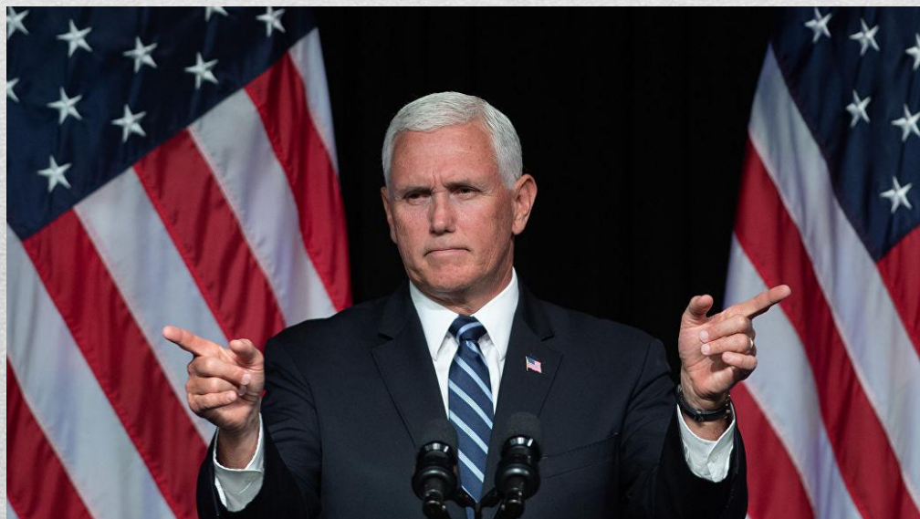
Майкл Пенс вице-президент США