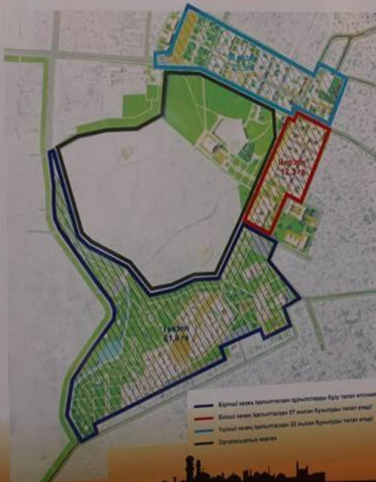
Аумақтарды игерiлу кезеңдерiне бөлiу схемасы