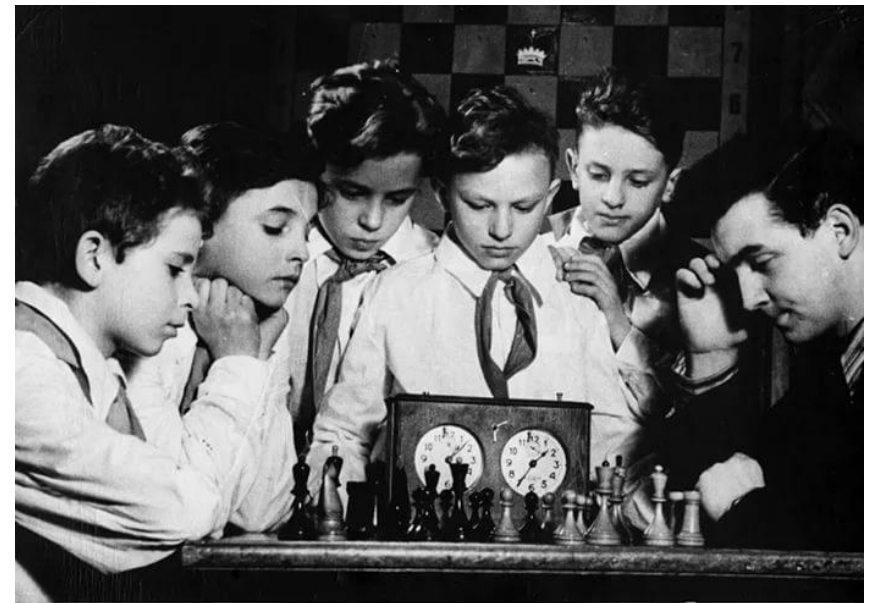
Марк ТАЙМАНОВ /справа/ играет с Борисом СПАСКИМ. Ленинградский Дворец пионеров и школьников, 1949 год.