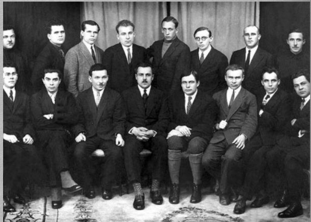
ВАПЛІТЕ (Харків, 1926)