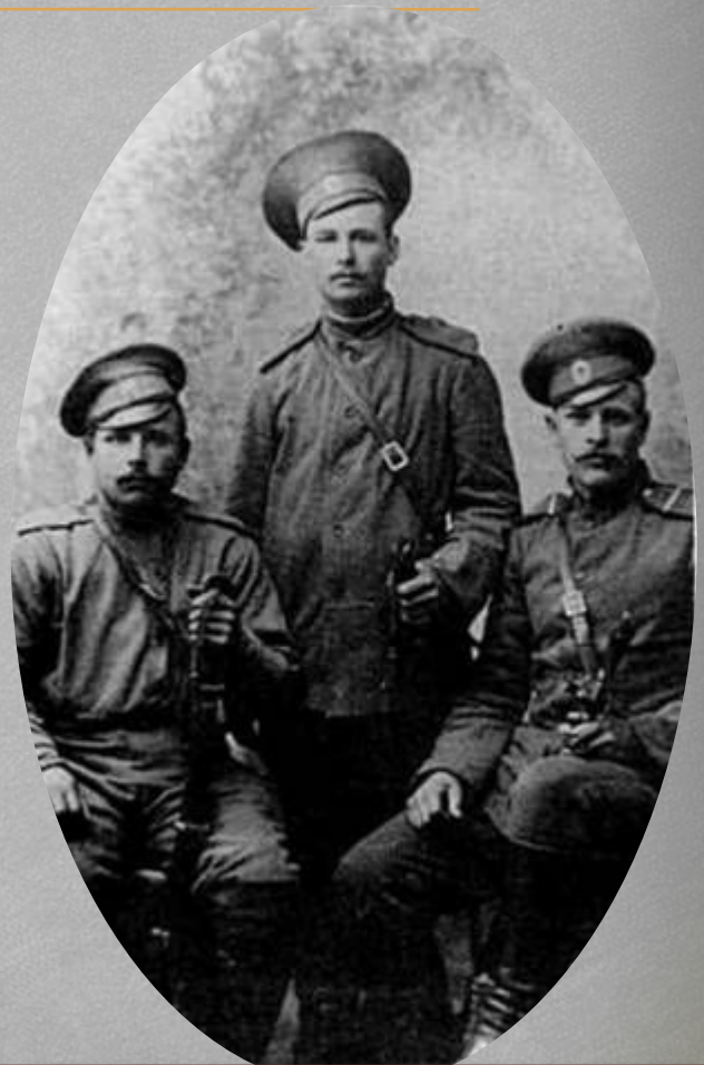
К "наступлению Керенского" в 1917 г.

Брав участь у Першій світовій та громадянській війнах. Частина, в якій перебував у грудні 1916 року Хвильовий, могла вирушити на фронт найраніше в березні 1917 року, а на фронт прибути в квітні-травні, коли фактично фронт перестав існувати. Хвильовий міг брати участь у фронтових баталіях, влітку 1917 року, коли голова Тимчасового уряду Росії О. Керенський спробував активізувати фронт до наступу, так звана П'ята Галицька битва (1917) або Офензива Керенського .