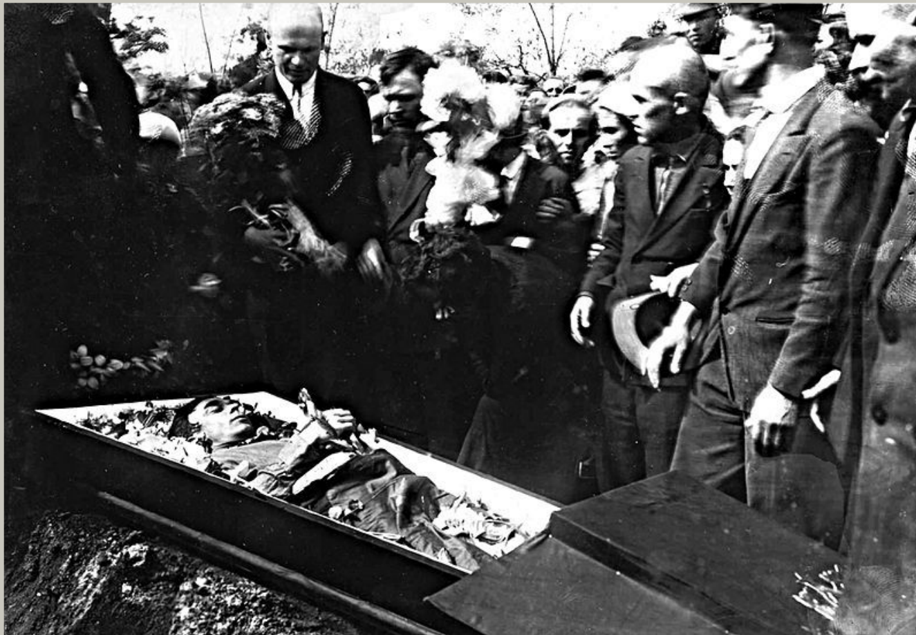
Похорони Миколи Хвильового (15 травня 1933 року)