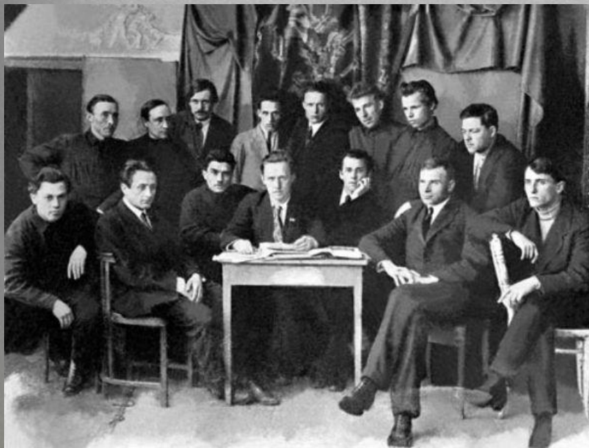
"Гарт" (Харків, 1924)