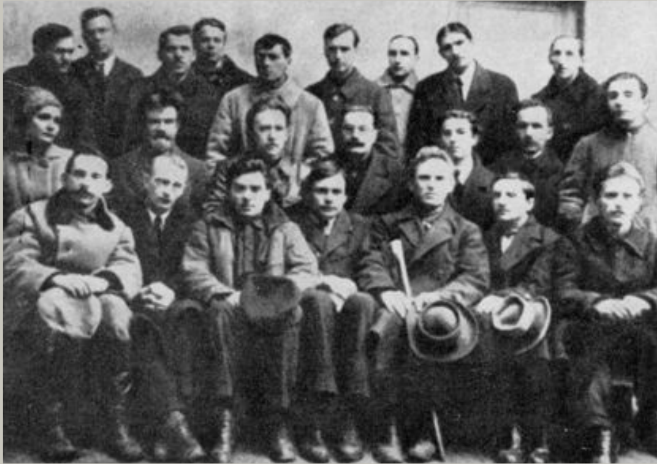
Київ, 1923р. М.Хвильовий серед діячів культури (нижній ряд, третій зліва)