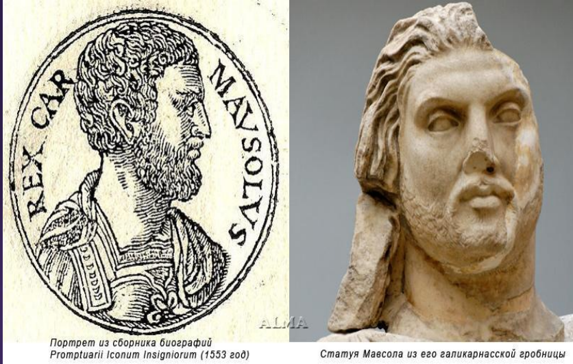
Портрет из сборника биографий Promptuarii Iconum Insigniorum (1553 год)