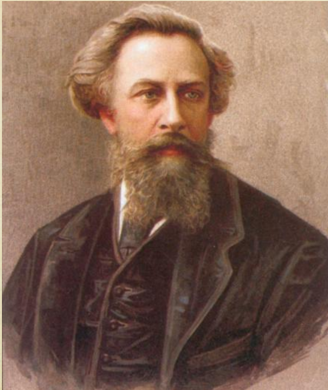
А.К. Толстой (1817–1875 гг.)