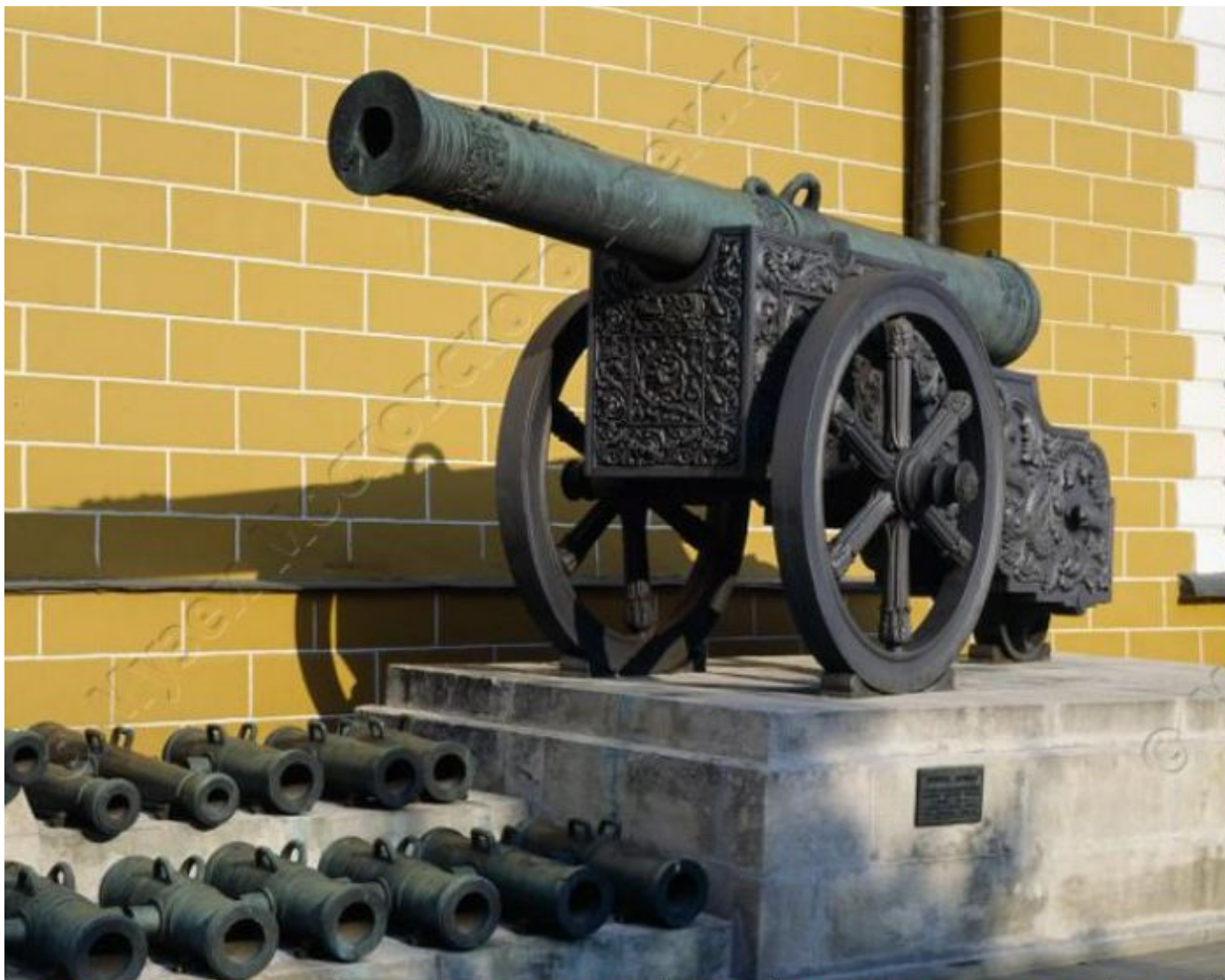
Пушка "Аспид" Мастер: Чохов Андрей. 1590 г.