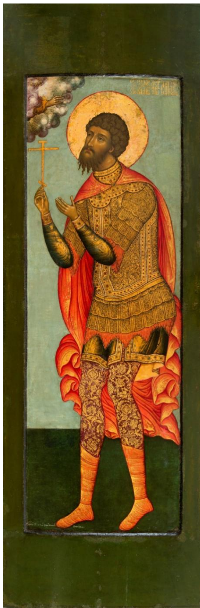
Икона "Федор Стратилат". Симон Ушаков. 1676. Из собрания Музеев Московского Кремля