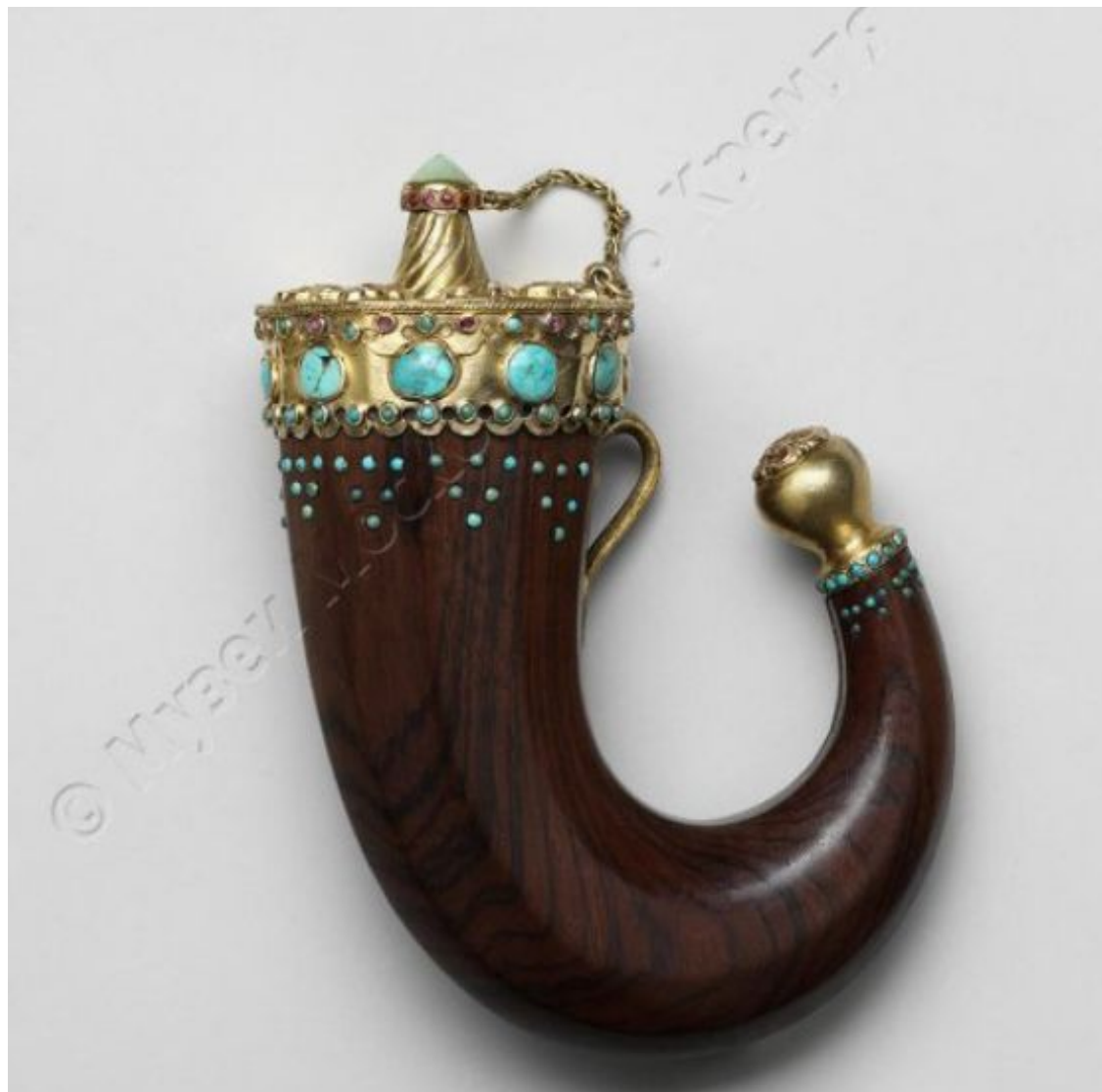
Пороховница. XVII в.