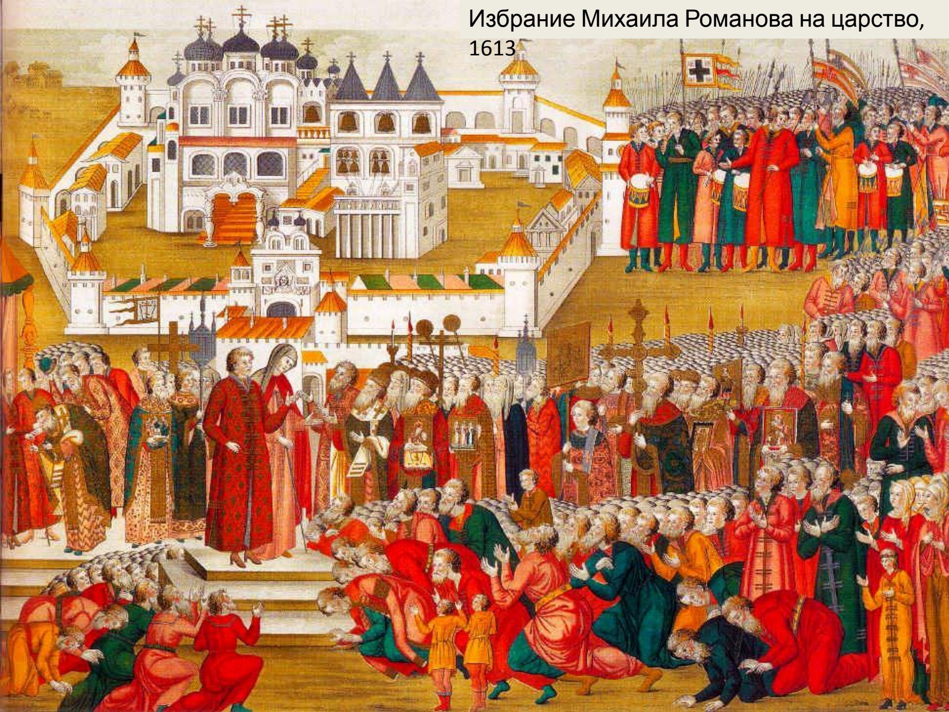
Избрание Михаила Романова на царство, 1613