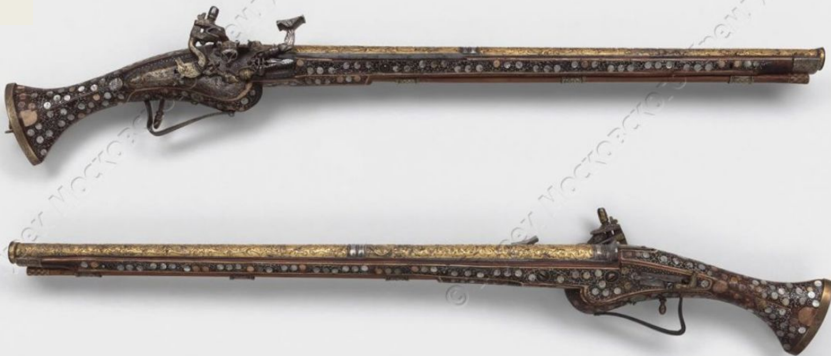
Пистолет с ударно-кремневым замком. Мастер: Тимофей Лучанинов. 1620-е - 1630-е г