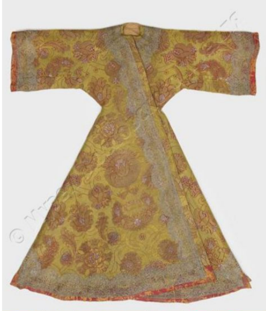
Кафтан становой царя Петра Алексеевича. 1689