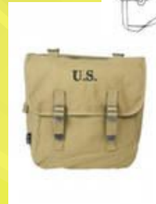
Вещевой и сухарный мешок