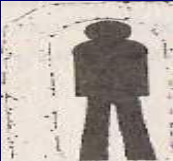
Рис. Различные зоны