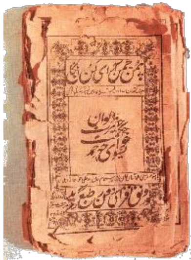
Обложка книги «Диуан-и-хикмет»