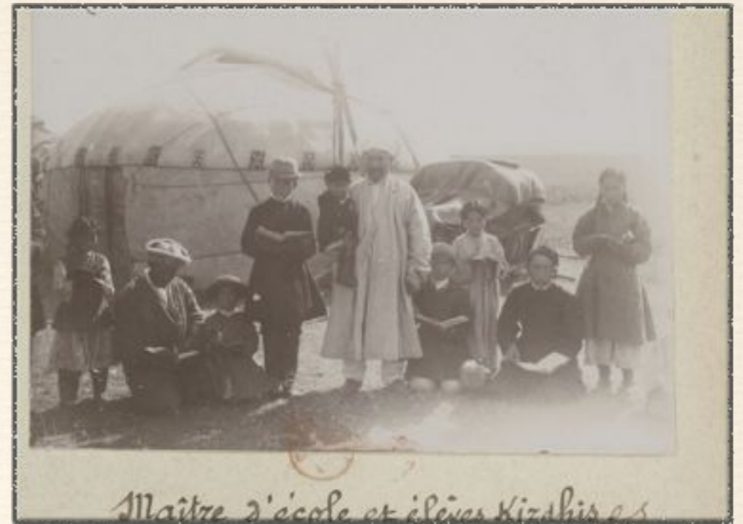
Maitre d'école et élèves Kizhis es