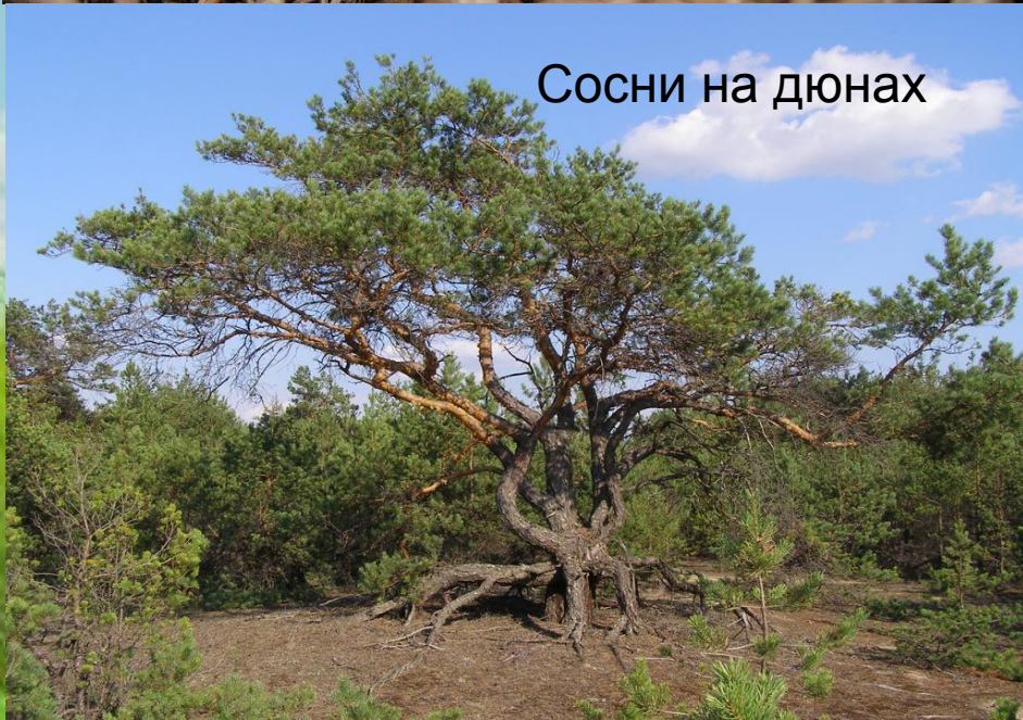
Сосни на дюнах