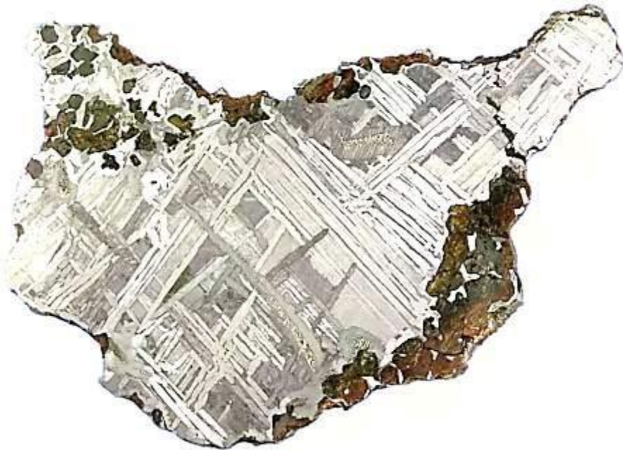
Узорчатое строение железного метеорита

Эти и другие данные свидетельствуют о том, что метеориты являются обломками астероидов.