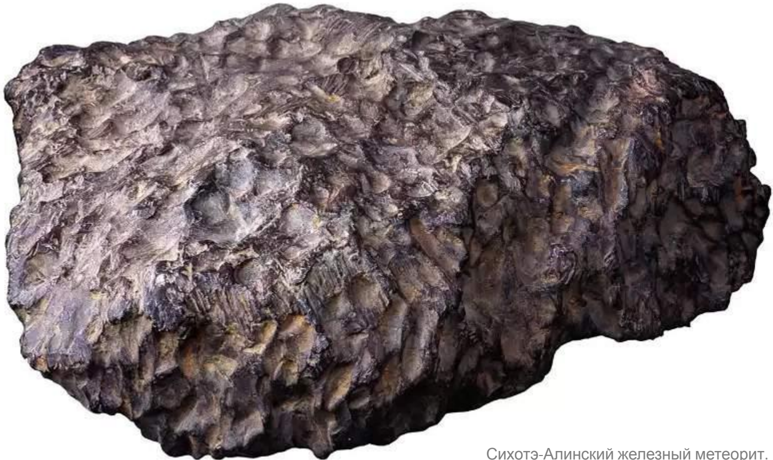
Сихотэ-Алинский железный метеорит. Фрагмент.

Самый большой из кратеров имел диаметр около 26 м и глубину 6 м.