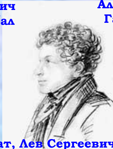
Брат, Лев Сергеевич Пушкин