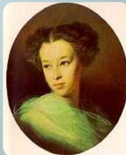
Младшая дочь, Наталья Александровна Пушкина (1836-1913г.)