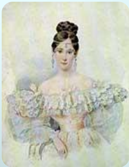
Жена, Наталья Николаевна Пушкина (1812-1863г.)