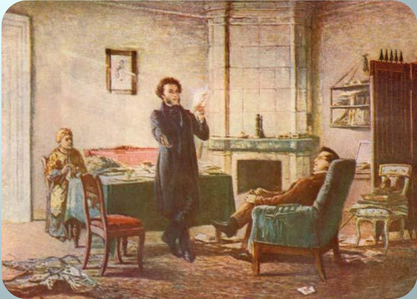
Встреча с И. Пущиным