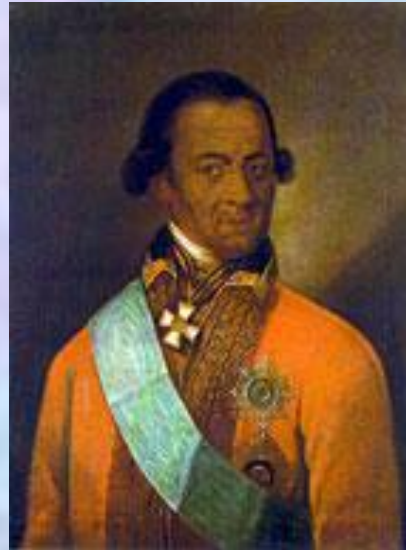
Прадедушка, Абрам Петрович Ганнибал