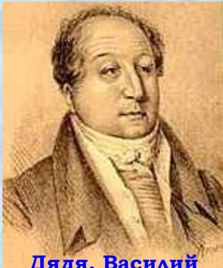
Дядя, Василий Львович Пушкин