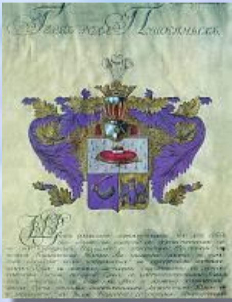
Герб рода Пушкиных