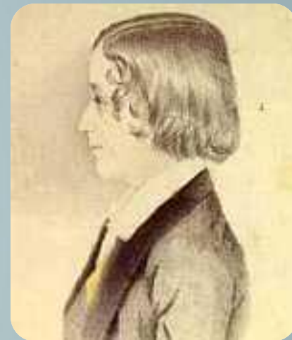
Старший сын, Александр Александрович Пушкин (1833-1914г.)