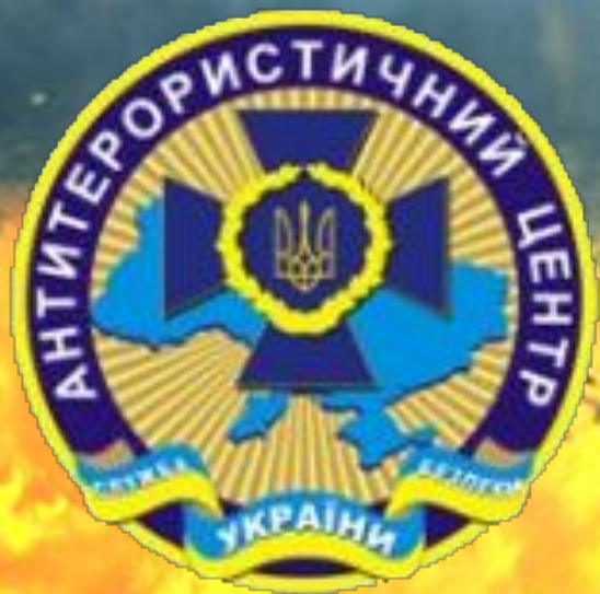
Антитерористичний центр при Службі безпеки України