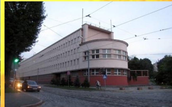
Управління Служби безпеки України в Львівській області