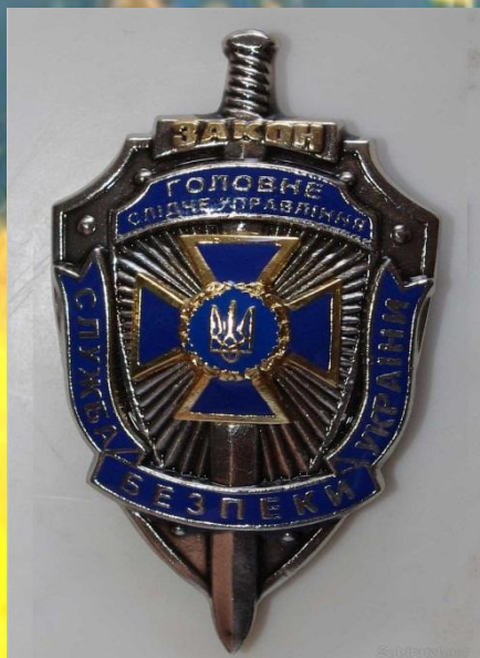
Символіка Головного слідчого управління СБ Україн