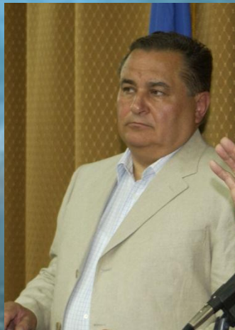
1. Марчук Євген Кирилович 06.11.1991 — 12. 07. 1994