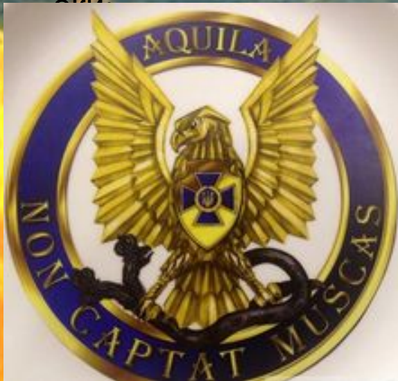
Символіка Департаменту контррозвідки СБУ