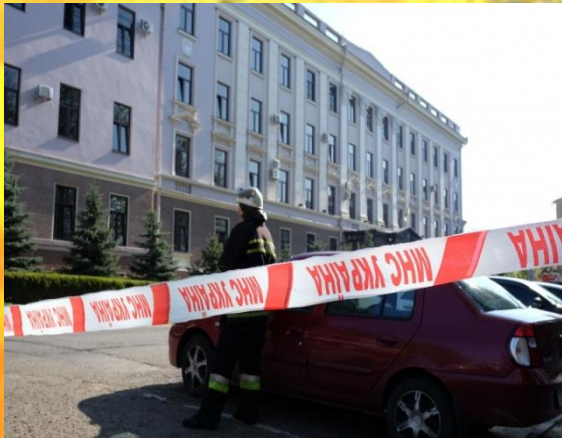
Управління Служби безпеки України в Закарпатській області

Начальники регіональних органів СБ України призначаються Головою Служби безпеки України з відома глав місцевих державних адміністрацій.