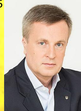
В.о. Наливайченко Валентин Олександрович