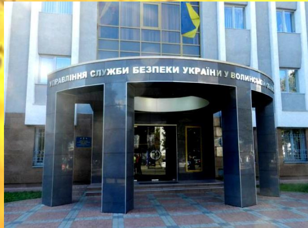
Управління Служби безпеки України в Волинській області