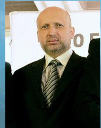
7. Турчинов Олександр Валентинович