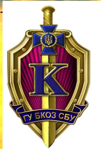
Символіка Головного управління «К» СБ