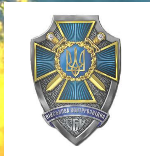
Символіка органів ВКР СБ України