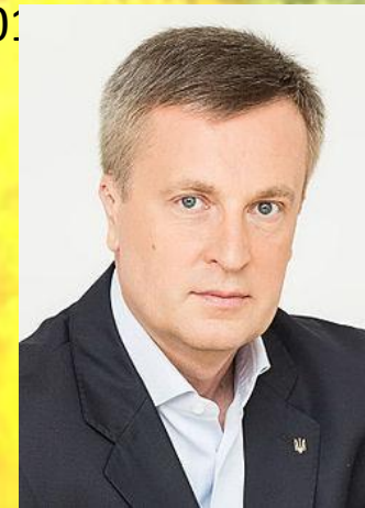
9. Наливайченко Валентин Олександрович