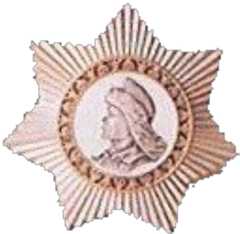
ОРДЕН САЛАВАТА ЮЛАЕВА