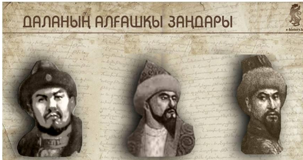
Қасым ханның «Қасқа жолы»