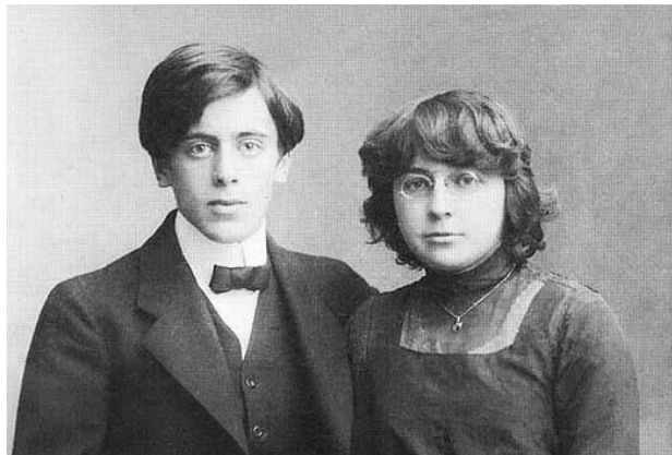
Марина Цветаева и Сергей Эфрон .

В Чехии написаны знаменитые «Поэма Горы» и «Поэма Конца», посвященные Константину Родзевичу. В 1925 году после рождения сына Георгия семья переехала в Париж. В Париже на Цветаеву сильно воздействовала атмосфера, сложившаяся вокруг неё из-за деятельности мужа. Эфрона обвиняли в том, что он был завербован НКВД и участвовал в заговоре против Льва Седова, сына Троцкого.