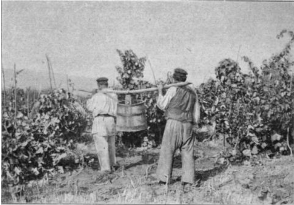
На виноградникѣ. Сборъ винограда.

Сільське господарство. Після селянської реформи 1861 р. Російська імперія залишалася аграрною країною.