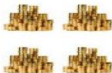
В виде ренты