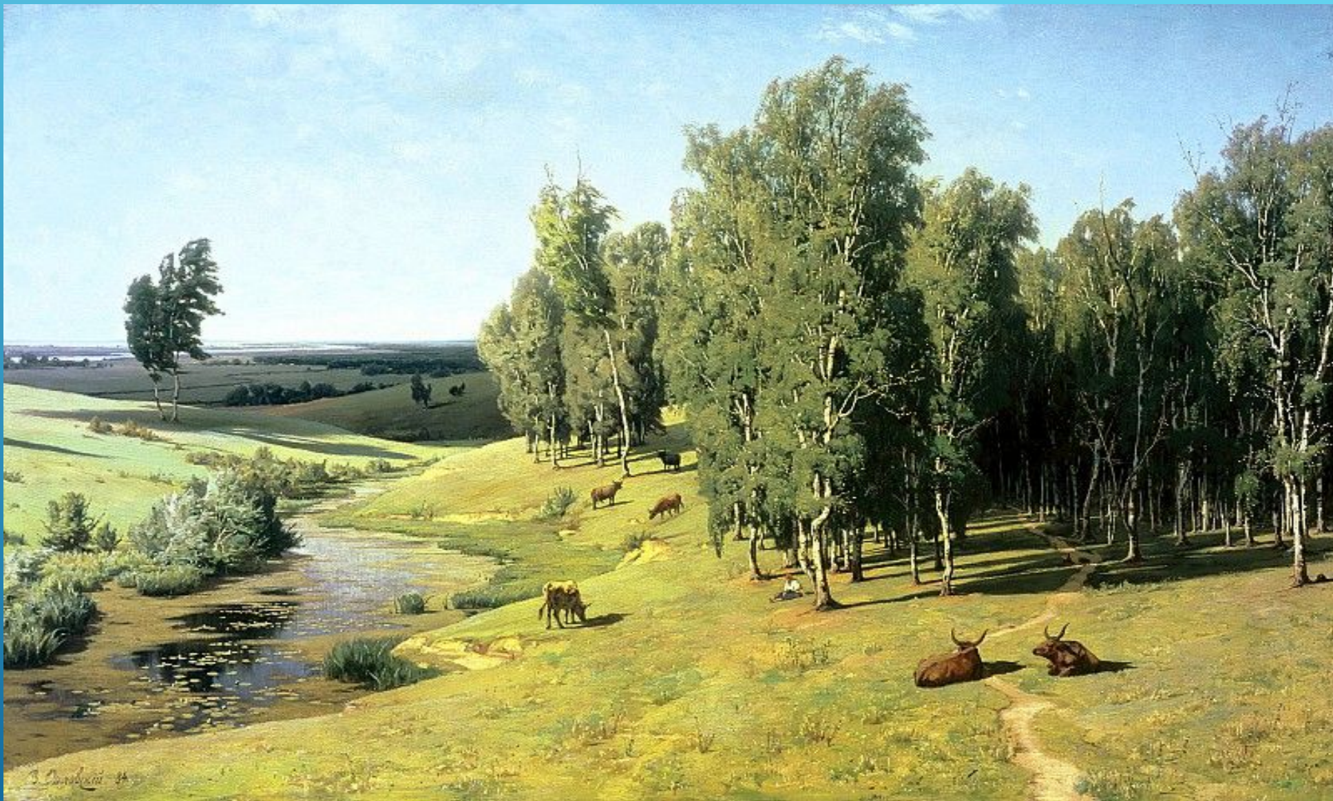
ВЛАДИМИР ДОНАТОВИЧ ОРЛОВСКИЙ, "ЛЕТНИЙ ДЕНЬ", 1884 Г.