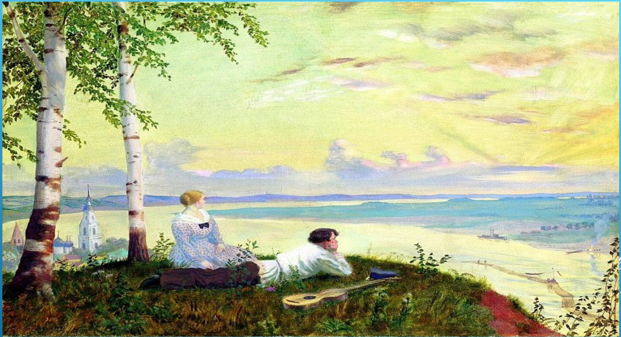
БОРИС МИХАЙЛОВИЧ КУСТОДИЕВ, "НА ВОЛГЕ", 1922 Г.