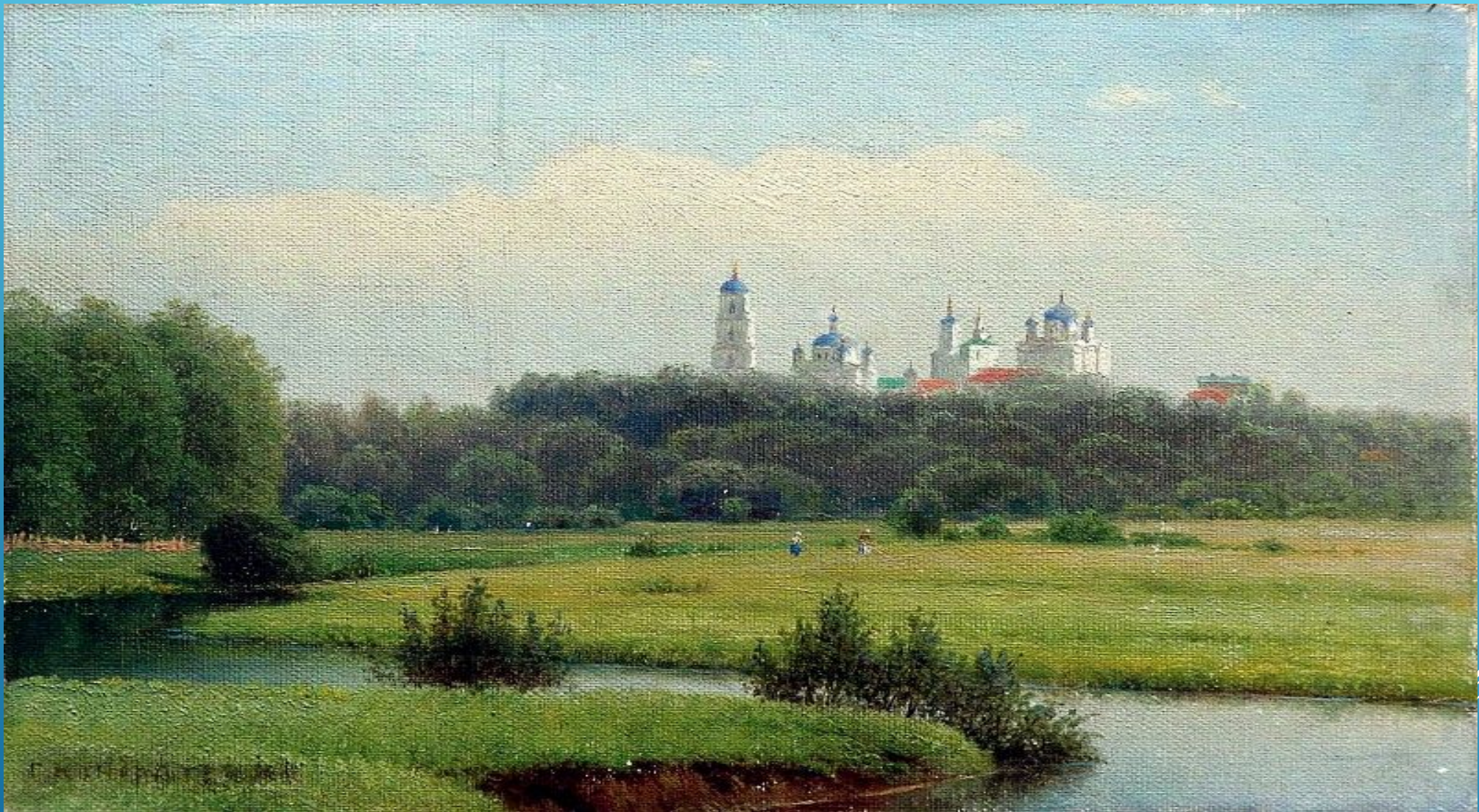
ГАВРИИЛ ПАВЛОВИЧ КОНДРАТЕНКО, "ЛЕТНИЙ ПЕЙЗАЖ. ВИД НА МОНАСТЫРЬ", 1880 Г.