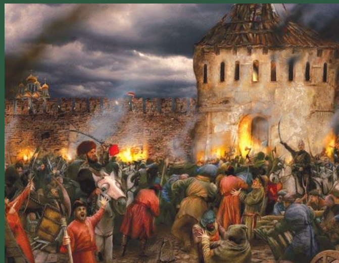
Созыв I ополчения в Рязани.

Центр - г. Рязань. Руководители: П.Ляпунов, князь Д.Трубецкой, казачий атаман И. Заруцкий