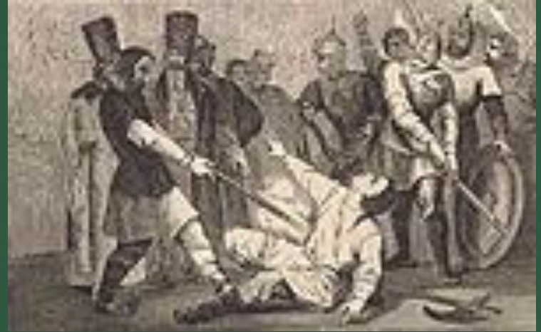
Смерть самозванца 16 мая 1606 г.

На рассвете 16 мая 1606 года вооруженный отряд под руководством В.И.Шуйского вошел в Кремль. С криком «Измена!» Лжедмитрий I попытался убежать, но был жестоко убит. Его труп подвергли торговой казни, посыпали песком, мазали дегтем. Среди жителей Москвы цареубийство вызвало неоднозначную реакцию, многие плакали, глядя на поругание. Его сначала похоронили в так называемом «убогом доме», кладбище для замёрзших или упившихся, за Серпуховскими воротами.