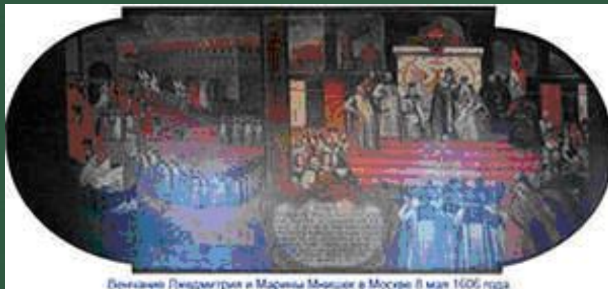
Богданов Дмитрий и Марина Мнишек в Москве 8 мая 1606 года