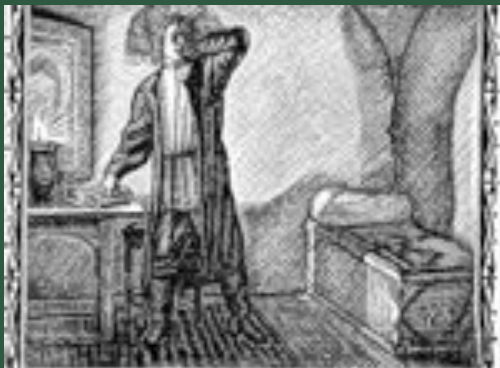
Григорий Отрепьев в монастыре

В 1602 г. в Польше объявился человек, который выдавал себя за чудом спасшегося царевича Дмитрия, младшего сына Ивана Грозного.