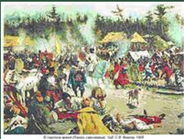
В старинном лагере Лжедмитрия II (С. В. Иванов, 1910)

Несмотря на то, что контролировал большую часть русского государства, в отличие от Лжедмитрия I, царем не считался.