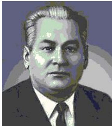
Генсек ЦК КПСС 1984-1985 К.У.Черненко