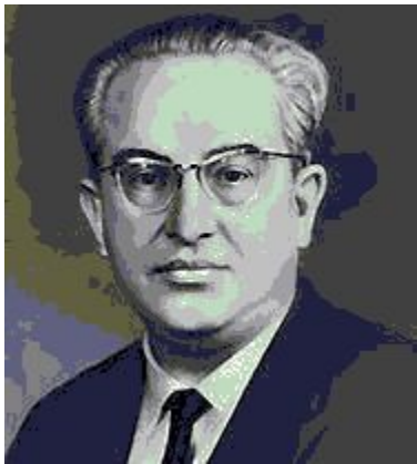
Генсек ЦК КПСС 1982-1984 Ю.В.Андропов