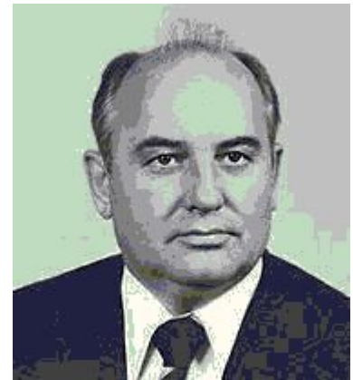
Генсек ЦК КПСС 1985-1991, Президент СССР 1990-1991 М.С.Горбачев