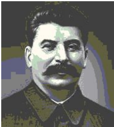
Генсек ЦК партии 1922-1953 И.В. Сталин