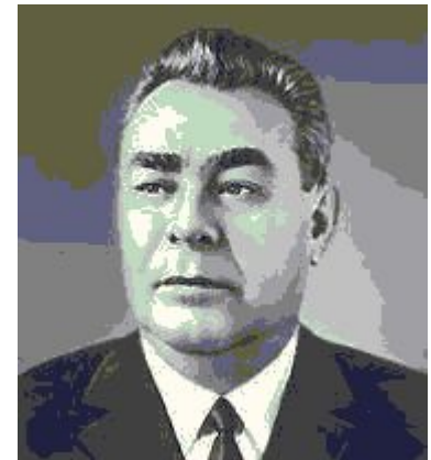
Генсек ЦК КПСС 1964-1982 Л.И.Брежнев