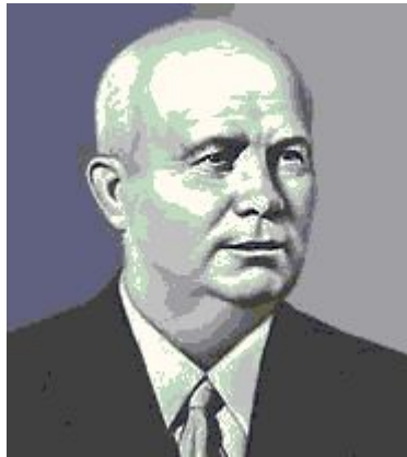
1-й секретарь ЦК КПСС 1953-1964 Н.С.Хрущев