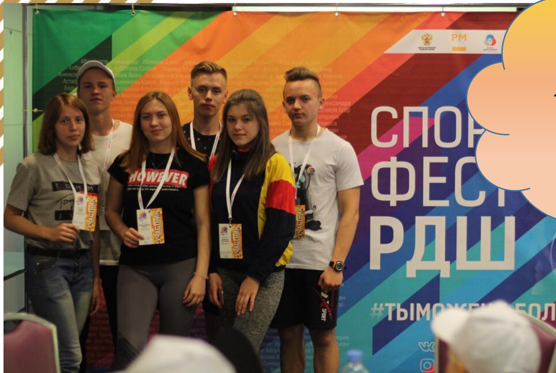
Команда из Опочецкого района