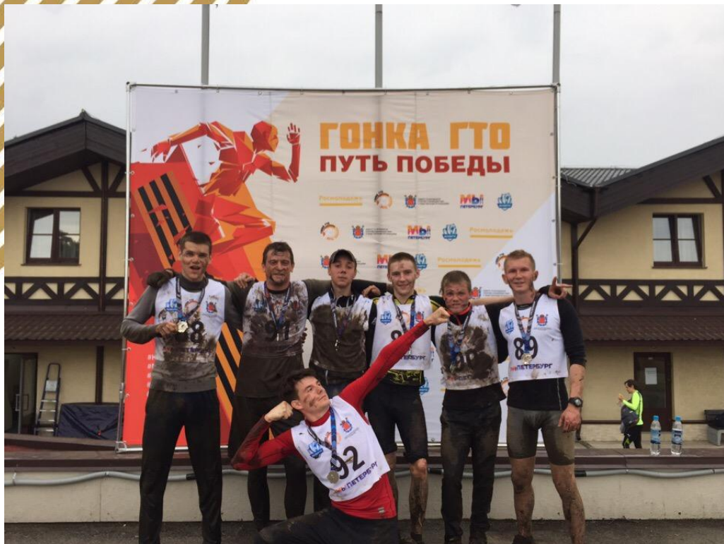
Команда Псковской области (студенты ВЛГАФК)