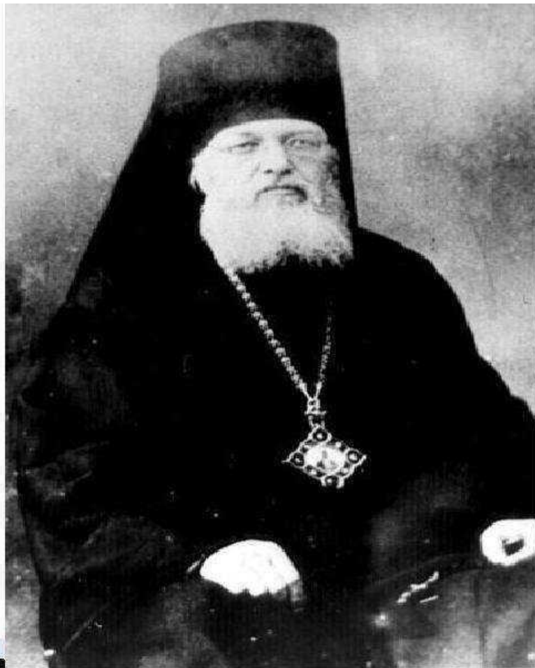
Валентин Феликсович Войно- Ясенецкий (Святой Лука)